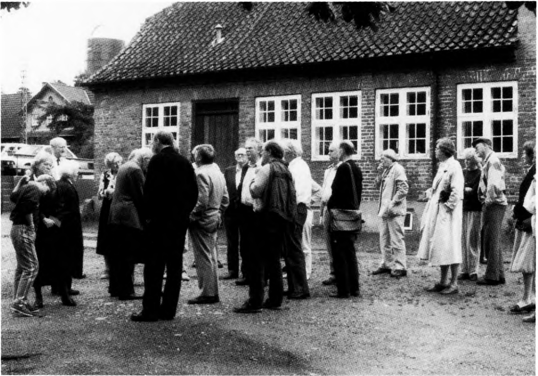
Søndagens veltilrettelagte busekskursion samlede en stor deltagerkreds.

enighed blandt deltagerne om, at årsmødet havde fundet sin rigtige form med styrkelsen af det faglige indhold, der var sket de sidste år, og også om, at det var vigtigt med udsendelsen af skriftlige materialer. Som noget nyt blev deltagerne ved nogle af temaerne delt i grupper, hvilket helt klart var fremmede for den meget livlige diskussion, der fandt sted.