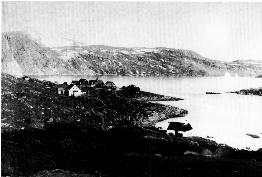
Upernavik 1909. Kolonibestyrerens bolig ses til højre for kirken. Rundt om anes tørvehuse med kajakstativer.

kunne der ikke føres tilstrækkelig kontrol med folk fra bopladserne, og så hjalp det ikke noget at enkelte bopladser afholdt sig fra handel. De kunne godt indse, at forbudet mod tuskhandel var begrundet i smittefare, men da handelen med hvalfangerne var foregået i så mange år uden skade, ville folk nok blive ved med den selvom de fik bøde.