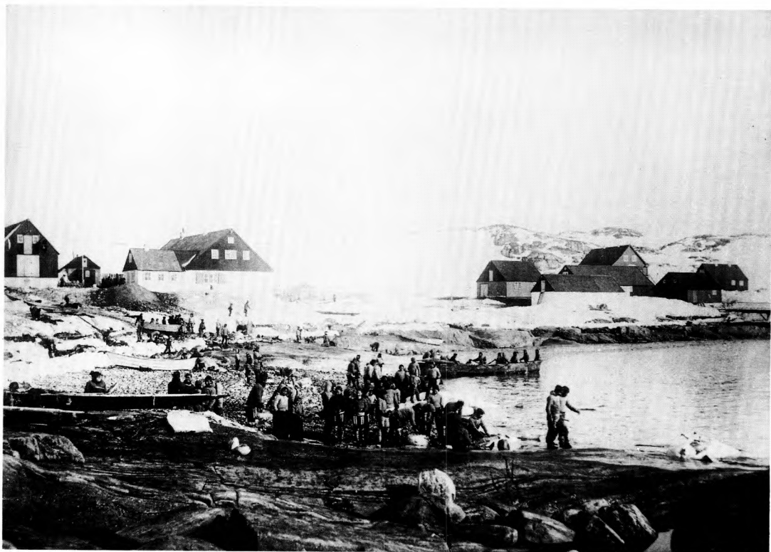
Hvalflæsning i Godthåbs kolonihavn 1905. Den hvide bygning med sort gavl var kolonibestyrerbolig (Hans Egedes gamle hus). Kgl. grønlandske Handels bygninger ses til højre.

derne at se andet end handelens interesse i dette forbud.