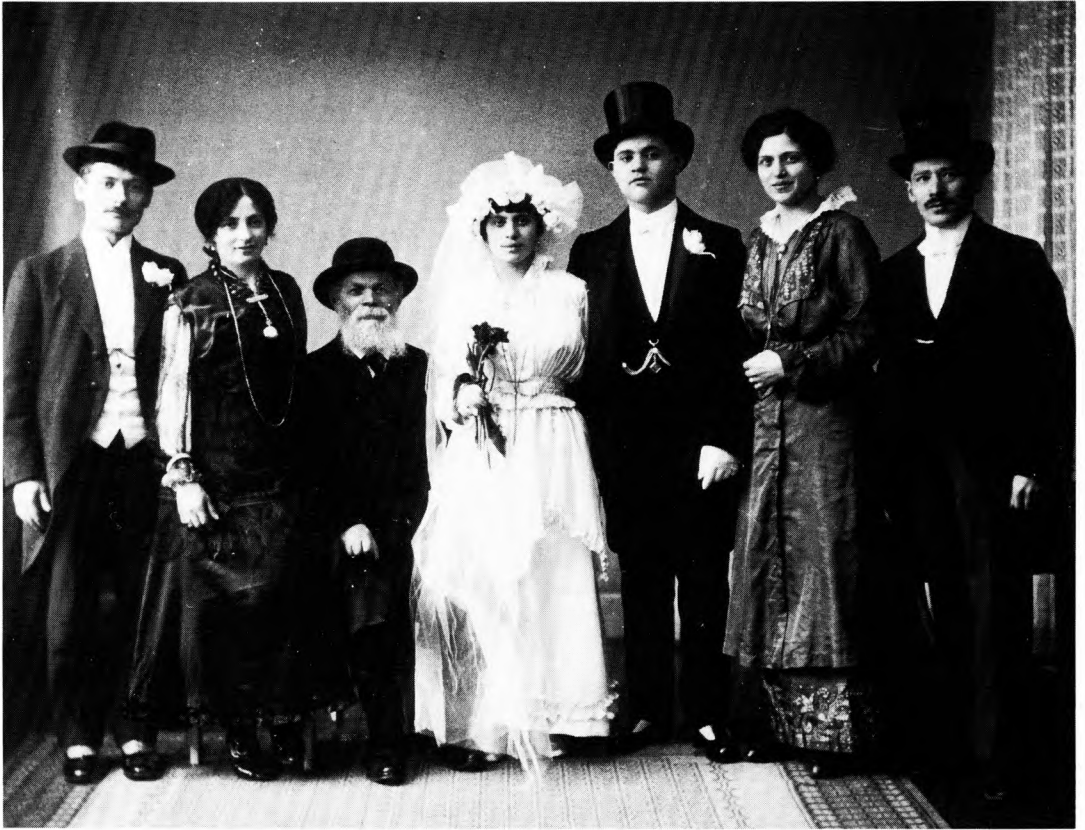
Immigranterne giftede sig stort set inden for immigrantmiljøet. Her ses et bryllup ca. fra 1908. Mange fotografier fra disse år er højst problematiske som kilde til miljøet. Normalt havde immigranterne ikke råd til at blive fotograferet, og når de blev det, var det på grund af festlige begivenheder, hvor billedet skulle bruges som hilsen til familien i Rusland og vise alt det man ikke havde opnået: velstand og tilpasning. (Foto i privateje).

jøder. De ønskede først og fremmest at være danske, og de mange østjødernes ankomst til København bekymrede dem i høj grad. Dels medførte immigranternes ophold her i landet en stærk stigning i menighedens fattigudgifter, dels risikerede de dansk-fødte jøder at blive sat i bås med disse østjøder og derfor blive anset for jøder i stedet for danskere.