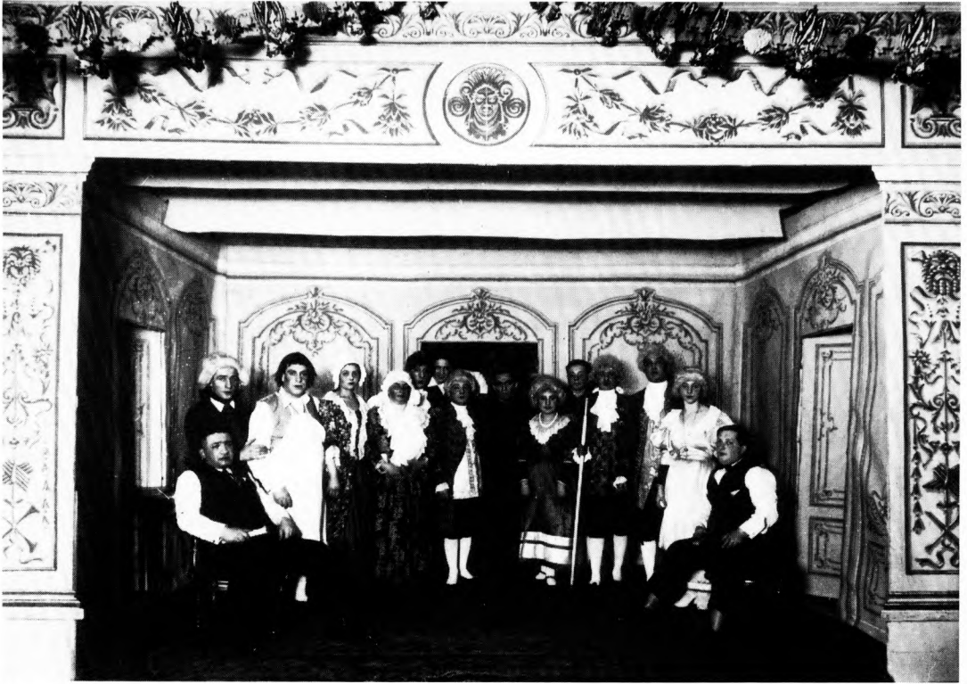
I ghetto-kvarteret omkring Pilestræde, Adelgade, Borgergade og Åbenråkvarteret blomstrede en rig jiddisch kultur. Man havde et jiddisch bibliotek og spillede jiddisch teater. Her ses en jiddisch teatergruppe, der opførte deres stykker i Ryegade fotograferet omkring 1912. Det var Molières »Den gerrige«, der måtte stå for skud.

smuglet over den tyske grænse. Men stort set var det efter 1917 slut med indvandringen.