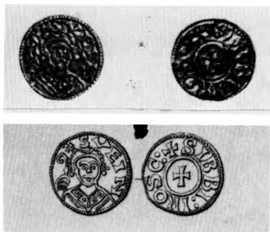
Mønt muligvis præget af Roskildebispen Svend Normand i Knud den Helliges regeringstid, jvf. note 40. Måske er der tale om et isoleret udleningsforhold. Efter Hauberg.

Normand; et forhold der i så fald ophørte ved biskop Svends død i 1088. 40 Man skal ind i 1100-årene før udleningsforhold bliver almindelige. Muligvis har kong Niels overdraget møntretten til Viborgbispens Eskil i løbet af hans lange regeringstid. 41 I hvert fald bliver udlening almindelig ved midten af århundredet. 42 I vesteuropæisk målestok er dette meget sent. I frankerriget optræder de første vidnesbyrd om udlening i 833, og udlening af (markeds- og) møntretten bliver hér almindelig i løbet af 800-årene. 43 I England antages bi-