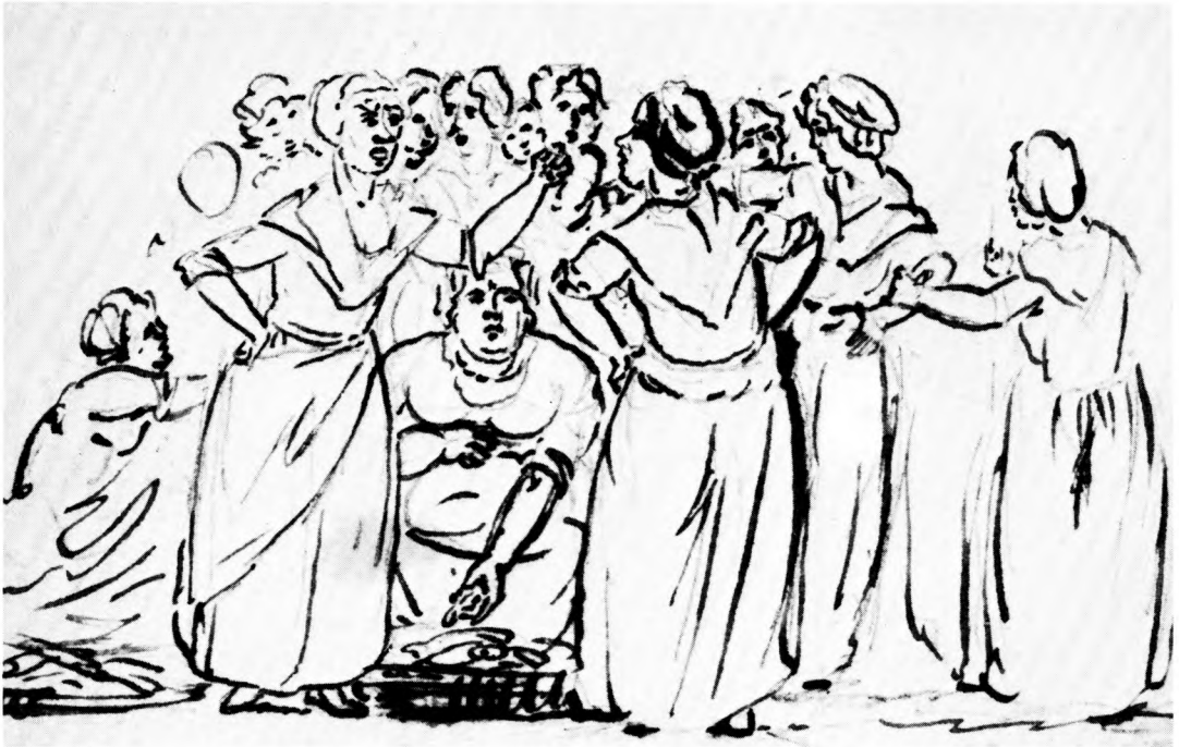
C. D. Fritsch tegnede enkelte situationsbilleder fra Københavns gadeliv. Blandt disse var et skænderi mellem torvekoner. Opgør mellem civile på gaderne prægede i høj grad bybilledet. Den kgl. Kobberstiksamlng.