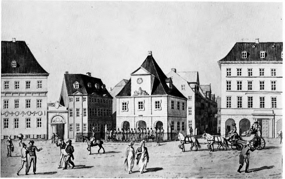
På Eckersbergs tegning fra 1807 ses Kongens Nytorv med hovedvagten. Hovedvagten opførtes 1723–24 og lå der indtil 1874. Til venstre for hovedvagten ses hjørnet af det gamle Hotel d'Angleterre, der ombyggedes i 1870'erne. Det var til hovedvagten arresterede førtes, og det var herfra forstærkninger hentedes, når politi og vægttere var i defensiven.

opstod opløbene spontant på gaderne, og de tilløbende var en blanding af forskellige erhvervsgrupper.