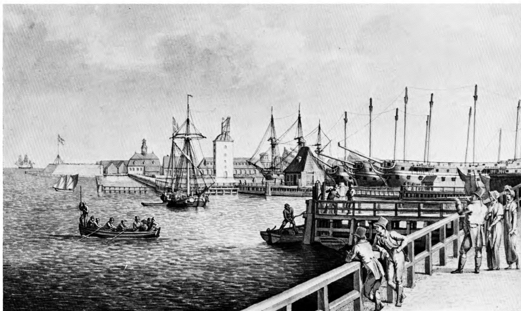
Eckersberg tegnede i 1807 udsigten fra Langelinie mod Nyholm. Gammelholm og Nyholm var byens største arbejdsplads. Matroserne og tømmere mændene derfra udgjorde et væsentlig indslag i byens gademiljø, og på grund af arbejdspladsens størrelse var det her, at bl.a. faglige konflikter slog kraftigst igennem. Den kgl. Kobberstiksamling.

gende Nørreport vagt, men vagten blev nærmest stormet af mængden, og flere betjente led overlast ved stenkast.