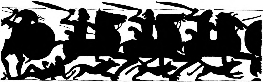
Fig. 2. Rytterfolk med hugsværd og fodfolk med spyd ses malet på en sarkofag fra Klazomenai i Lilleasien, 6./5. årh. f. Kr. (British Museum). Rytterne synes at være kimmerier, som kom til Lilleasien 680-670 f. Kr., da de flygtede for skyterne. Før da var kimmerierne i bronzealderen en rytterkultur på de sydrussiske stepper og ind i Europa. Rytternes andet våben, buen, stikker op bag dem over hestenes kryds. På sarkofagen ses endvidere fodfolk med stiksværd. Altså infanterister med spyd og stiksværd, kvallerister med bue og hugsværd. (Tegning: S.N.-K.).

religiøst monopol. OK, ethvert system kan bringes til at passe, hvis man udelader det, man ikke kan få til at passe i systemet.