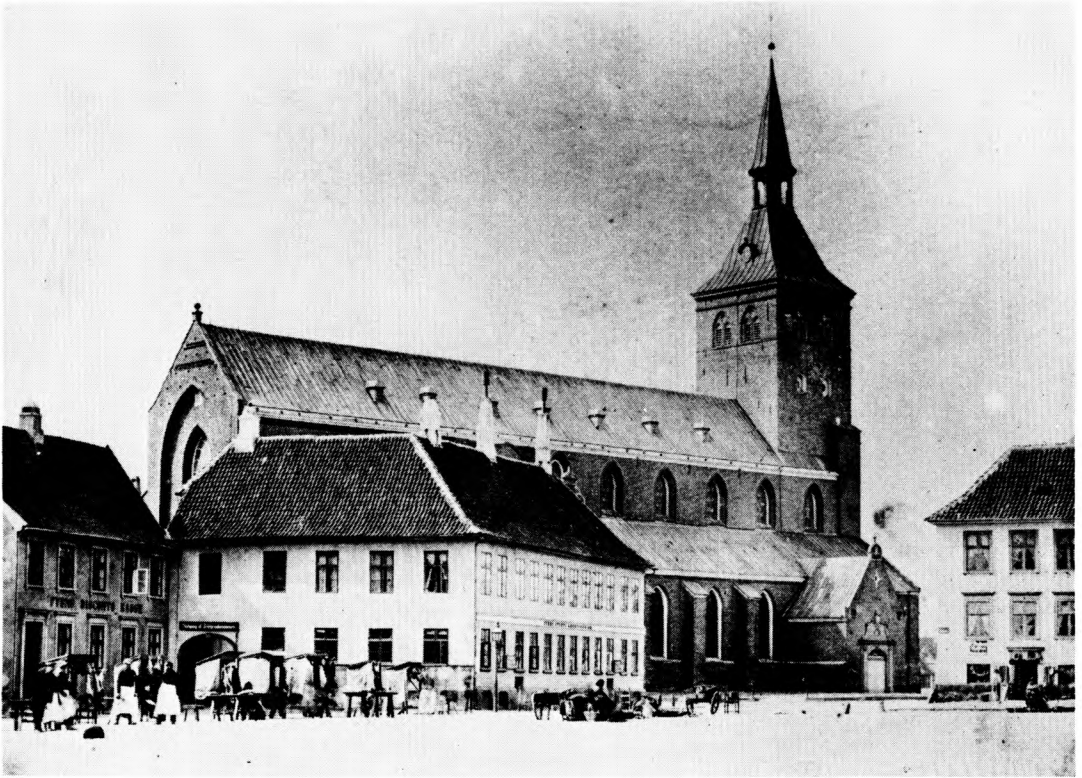
Albani Torv med Fyens Stifts Læseforenings bygning foran Skt. Knuds Kirke o. 1860. I 1880'erne fik bygningen tilføjet side- og baghus. Samtidig blev der i Læseforeningens have, der med en bro var forbundet med en ø i Odense Å, anlagt croquetbaner og opført en musikpavillon.

gyndelsen af 1800-tallet have eksisteret et læseselskab, som gik ind i 1819 11 . I det her behandlede tidsrum (1870–1900) fandtes der på Fyn fem købstadslæseforeninger: Fyens Stifts Læseforening i Odense (oprettet 1838), Fåborg og Omegns Læseselskab (oprettet 1852), Middelfart Læseforening (oprettet i sidste halvdel af 1880'erne), Nyborg Læseforening (antagelig oprettet i 1850'erne), Det langeslandske Læseselskab i Rudkøbing (antagelig oprettet i 1800-tallets første halvdel). Af hensyn til overskueligheden vil jeg imidlertid koncentrere mig om den største læseforening,