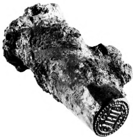
Fig. 1. Det vistnok eneste danske billede af møntprægningsværktøj er dette spænde, der indkom til Nationalmuseet 1823 som jordfund fra Bornholm. Dets latinske indskrift betyder »Didrik, møntmesterens broder«, og fundstedet antyder, at møntmesteren var fra Lund. Øverst ses en glødehage som brugtes til at trække digler med smeltet metal ud fra ilden. Til venstre herfor følger understempel med spids til at fastgøre i træblok, overstempel til at holde på samt hammer til prægningen. Datering: formentlig 1200-tallet. Diameter: 55 mm. Inventarnummer: Nationalmuseet 2. afdeling MLXVIII a.