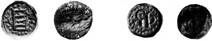
Fig. 3-4. For- og Bagside af stempelstykker fra Erik Menved, Lund, Hauberg nr. 9, Mansfeld-Büllner 302 samt Magnus Eriksson Smek, Lund, Hauberg 1, Mansfeld-Büllner 638. Motiverne er henholdsvis Sankt Laurentius' rist og et »R« omgivet af halvmåne og stjerne. Kulturen, Lund inv. KM 22.826.

blot fire stempel-»hoveder«, alle fra Lund 7 . Årsagen til, at det kun var den øverste del af over- eller understemplet, der var fundet, kan være, at denne var af særlig hærdet stål, som blev opbevaret for sig og i øvrigt havde en kortere levetid end selve stempel »kroppen«. Tykkelsen varierer fra en halv til godt tre cm. Efter at møntmotivet var islået med små specialstempler, punse, eller indgraveret, er det lille stempelstykke blevet fastgjort til selve stempelkroppen – man kan se spor af de tapeller studshuller, som har været benyttet ved fæstelsen (fig. 4). Det ældste af disse stempler er fra Christopher I.s tid (1252–59), mens det yngste er omkring hundrede år yngre. To af stemplerne var fundet nær møntsmedjens gamle område syd for Domkirken. I 1975 fandt man så i Lund det første hele stempel, et overstempel fra Erik Plovpenning's tid (1241–50) (fig. 2). En røntgenundersøgelse viste også en tydelig skillelinje mellem stemplets to dele 8 . At forholdet har været det samme i England i vikingetiden tyder et af de