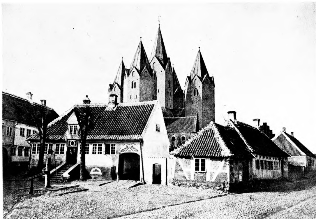
Pladsen i Adelgade i Kalundborg i 1871. Det todelte bindingsværkshus til højre er spindeanstalten. Bag ved denne ses det fattighus der blev bygget kort efter fattigvæsenreformen i 1803.

Spindeanstalten var imidlertid kun den ene halvdel af forslaget til betleriets afskaffelse. Den anden var en tvangsmæssig fjernelse af betleriet. Til dette formål indsendte patrioterne (som de kaldte sig selv) en petition til kongen om at måtte skærpe midlerne til at overholde anordningerne mod betleri. Denne tilladelse fik man i resolution af 10/10 1794. Kancelliet gik endda videre end forespørgselen ved at påbyde magistrat og sognepræst at befordre arbejdsanstalten: