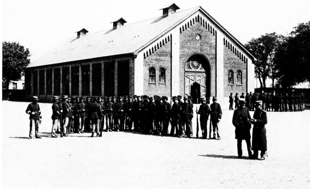
Eksercerhuset i Øster Voldgade, Fredericia, hvor folketingsvalgene fandt sted. Foto fra omkr. 1900. Kgl. bibliotek.

et samfund af den pågældende type på trods af alle dominerende normer alligevel stemmer på et arbejderparti, der udviser en afvigende adfærd, som det også ud fra en sociologisk synsvinkel er vigtigt at finde forklaringer på.