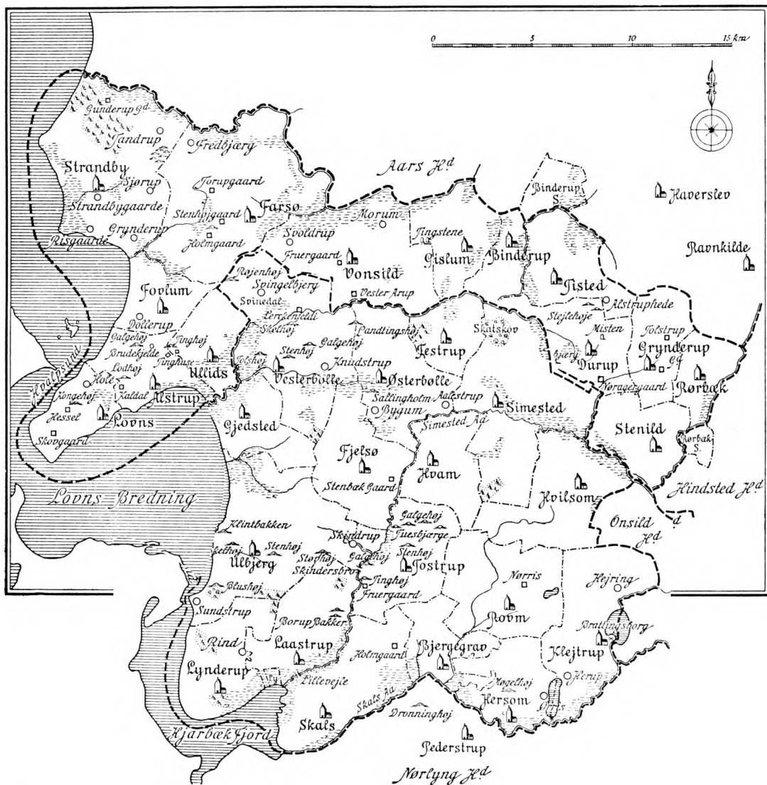
Figur 2. Lerkenfeldt-egnen.

[Efter: Thorkild Gravlund, Herredsbogen, Jylland (Kbh. 1930) s. 214 og s. 219]