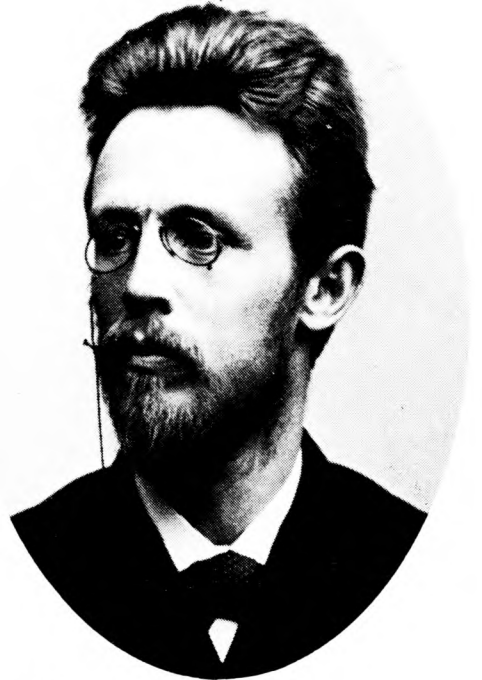
Kristian Erslev, historiker, 1852-1930.

lev'sk nøgleord, ordet »Beretning«. Det komplementære begreb er »Levning« (eller bare levn). Mod slutningen i opgøret med Paludan-Müllers sagnkritiske metode trækkes disse to begrebs indbyrdes forhold frem. Hvis der skal sættes skel mellem kilder, må det være mellem disse to, levn og beretning, ikke mellem mindesmærker, sagn og myter. På daværende tidspunkt var Kristian Erslev tilbøjelig til at finde forskellen mellem levn og beretning i kilderne selv: Beretninger (og altså herunder sagn) »er Fortællinger om Fortiden «, mens levn er »selve de endnu eksisterende Reste af Fortidens Liv .« 113 Siden, i 1911, da de reviderede »Grundsætninger« blev til bogen om »Historisk Teknik«, er levn og beretning