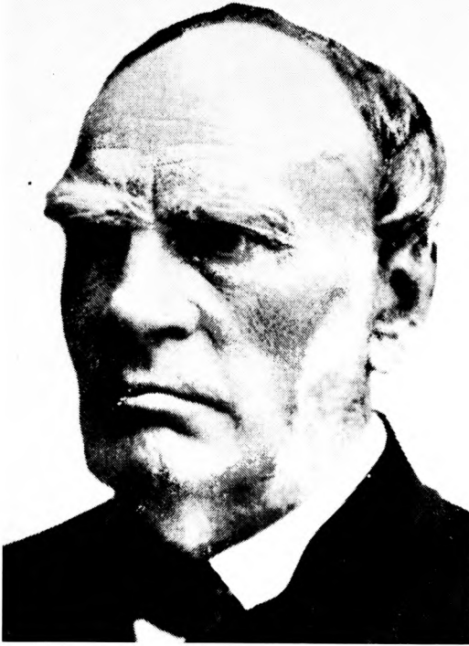
Caspar Paludan-Müller, historiker, 1805-83.