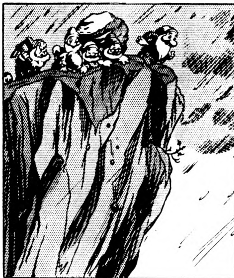
Figur 4. Snehvide.

....og den onde dronning bliver hvirvlet ud over kanten af klip- pen....ned i af- grunden, hvor hun slår sig ihjel!