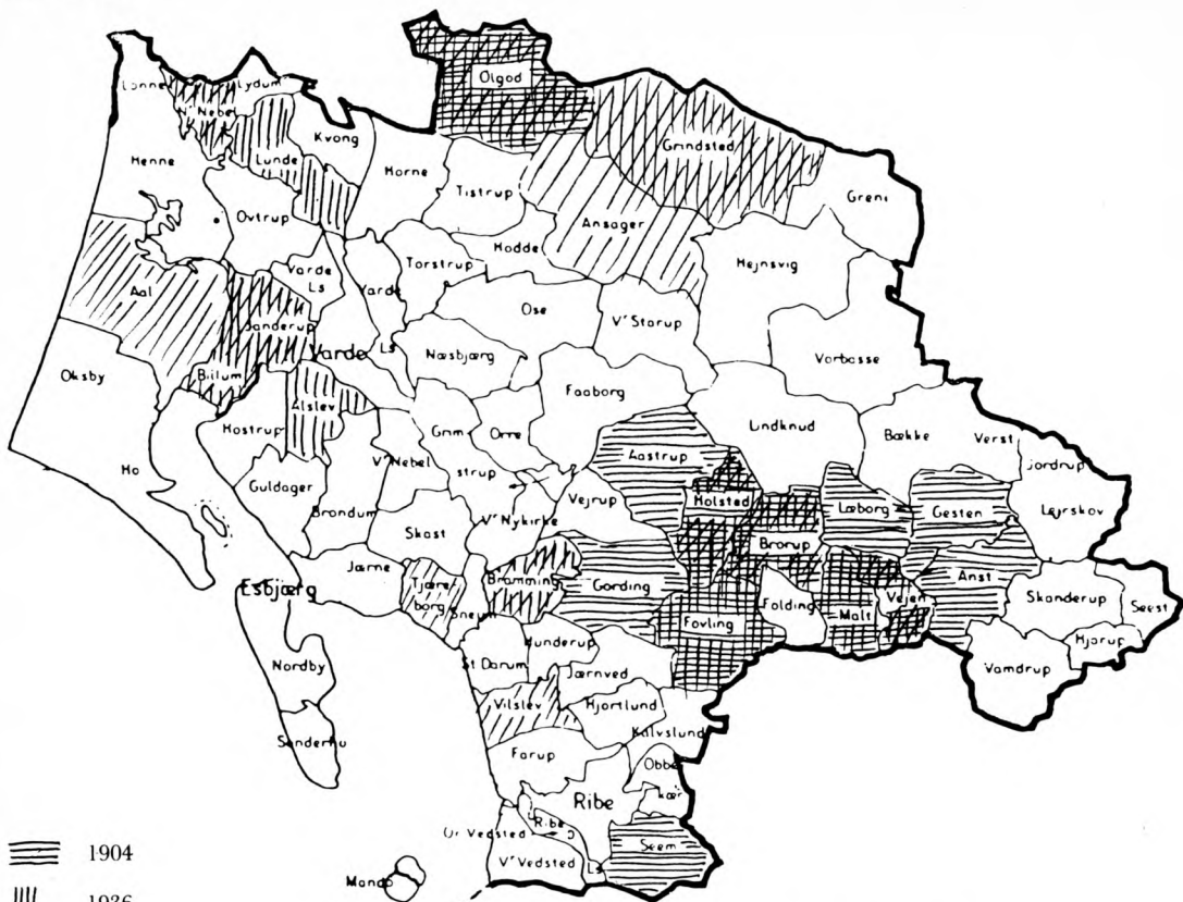
De 12 medlemmæssigt største sogne 1904, 1936 og 1980. Nævnt alle tre år: Vejen, Brørup, Holsted, Ølgod. Nævnt 1904 og 1936: Malt, Føvling. Nævnt 1936 og 1980: Nr. Nebel, Billum-Janderup, Grindsted, Bramming.

Naturligvis er intet det samme som før. Landmand i dag er ikke hvad en gårdejer var og et sogn er ganske anderledes end for en generation siden. Den tekniske og industrielle udvikling kom senere til Vestjylland end til det øvrige Danmark og denne forsinkede proces kan bl.a. have haft betydning for foreningsdannelse og foreningstradition. De gamle foreninger holdt længere ud og f.eks. fagforeningerne havde sværere ved at få rigtig fat i befolkningen i hvert fald uden for Esbjerg. 8 Så al forskel til trods er der en betydelig kontinuitet i medlemsskaren, ikke blot i den geografiske spredning (eller rettere koncentration) men også i sammensætning og struktur. Vi er meget opmærksomme på at