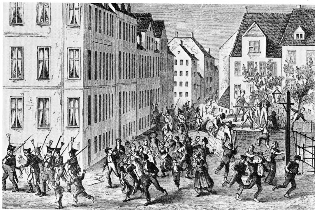
Fig. 4. Jødefejden 1819-20.

»Naomi lod Glasset i Karreetvinduet glide ned og stirrede ud. Østergade, som de skulde igennem, var aldeles spærret af Mennesker; vilde Skrig lode, Ruder klirrede, der faldt Skud . . .«