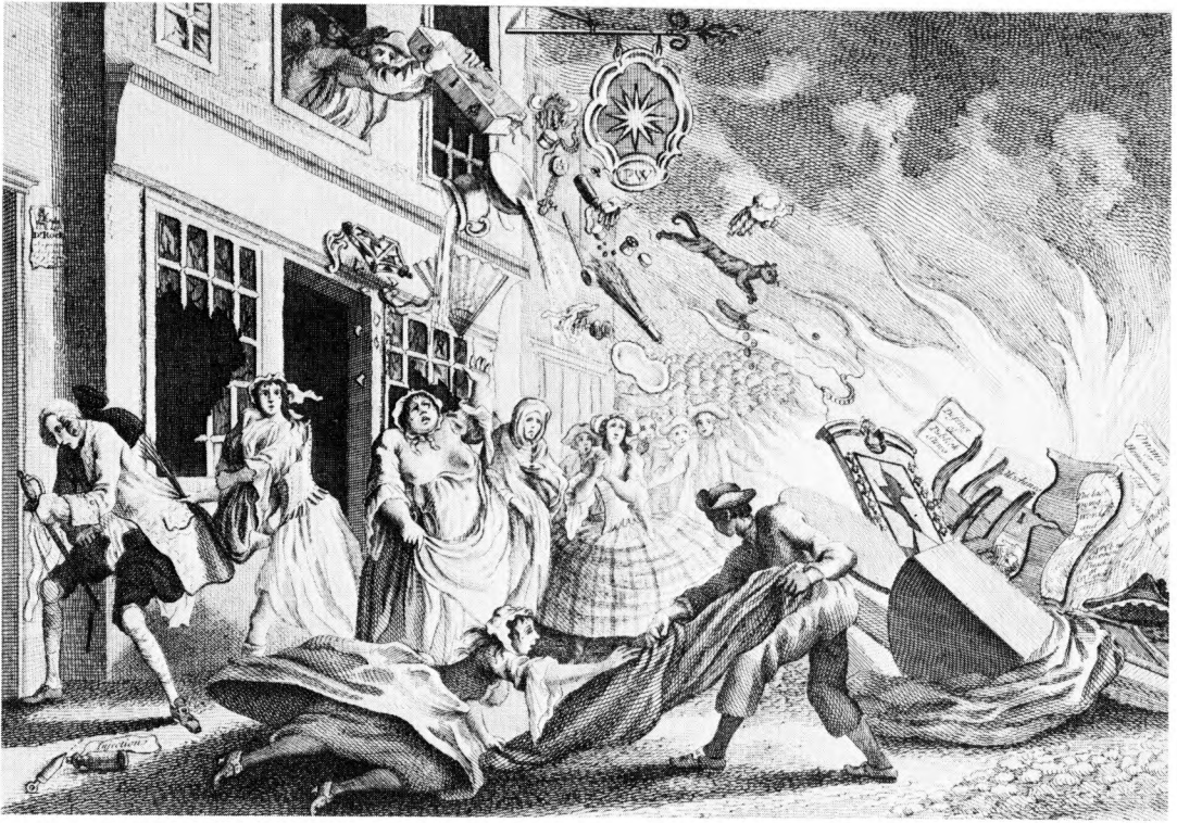
Fig. 2. London 1749.

»... they returned at night, broke open the house, turned the women almost naked into the street, ripped up the beds, threw the feathers out of the window, broke the furniture in pieces, and made a bonfire of it« ( Malefactors' Register, or, the Newgate and Tyburn calendar 3 (1770), s. 237 ). 'The Tar's Triumph', British Museum.