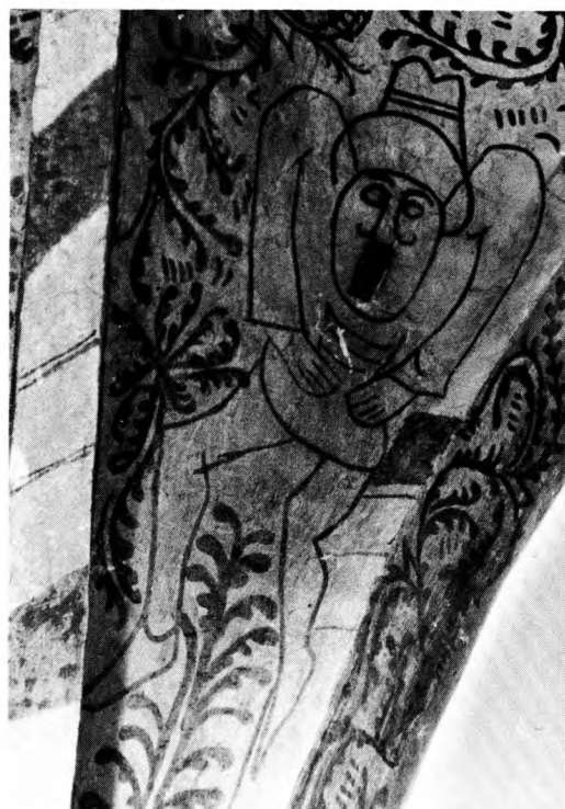
Foto 8: Som et eksempel på en ommaling kan nævnes »anstændiggørelsen« af et kalkmaleri i Lyngby kirke. En nærlignende mand, der tisser ned i hovedet på menigheden, er blevet forandret til en mand der lidt akavet holder hænderne på maven. Lyngby kirke (Nordsjælland) ca. 1500.

Ligesom hvert malerværksted har sine egne ikonografiske karakteristika, har flere værk-