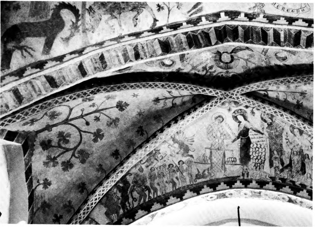
Foto 14: I øverste venstre hjørne ser vi middelaldermalerens forfejlede elefant sammen med et vildsvin. Hovedmotivet i næste kappe er Dommedagsscenen. De døde står op af deres grave, yderst til højre, for at blive vejret på Mikael Sjelvejers skålvægt. Gruppen i kappens venstre halvdel har ikke klaret frisag og er derfor dømt til evig fortabelse. Birkerød (Nordsjælland) 1300–1325.

bildning, hvor maleren ikke har haft noget praktisk kendskab, til det forlæggte foreskrev, ser vi i Birkerød kirke. Broby-Johansen skriver i »Den danske billedbibel i kalkmalerier« (Kbh. 1947) p. 188: »Synd og sorg gnaver ved livstræets rod. Det grå vildsvin borer sine hugtænder ind i barken og den mørkebrune helhest saver i stammen med sine skarpe nakketænder.« Det mærkelige dyr er ikke en helhest, men, som Broby antyder i en senere udgave, en elefant med kamptårn på ryggen. Maleren har helt åbenbart aldrig set en elefant, men har sikkert fået oplysninger om dyrets særpræg (trompetsnabel og kompakte ben), som han så har kombineret med hestens velkendte anatomi. Malerens forfejlede elefant, har imidlertid ikke nogen indflydelse på scenens symbolik, der ikke skildrer synd og sorg, men kampen mellem de gode og onde magter.