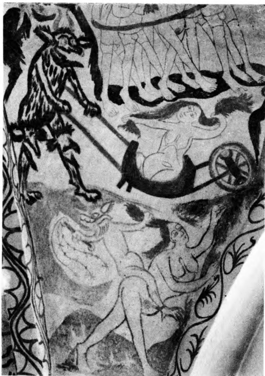
Foto 2: Middelalderens kalkmaler har med gru og rædsel udpenlet transporten til helvedetsgabet. Vi ser en djævel der siddende overskrævs på en kvinde rider afsted, mens en anden kvinde køres på møgbør lige lukt i helvedet. Scenen har virket stærkt på middelalderens uoplyste menighed – som den gør det på os i dag. Mørkøv 1450–80 (Nordvestsjælland).

ikke nok at kunne forstå de enkelte elementer i maleriet, man må også have indblik i billedets konventioner samt vide noget om billedlæsning. Som eksempler på konventioner i kirkelig kunst kan nævnes: lam med korsfane og blod – et symbol på Jesu død; glorier og forskellige attributter identificerer helgener og evangelister (S. Laurentius med rist, evangelisten Lukas med vinget okse). Billederne bliver derfor kun forståelige for folk, som kender symbolernes konventioner.