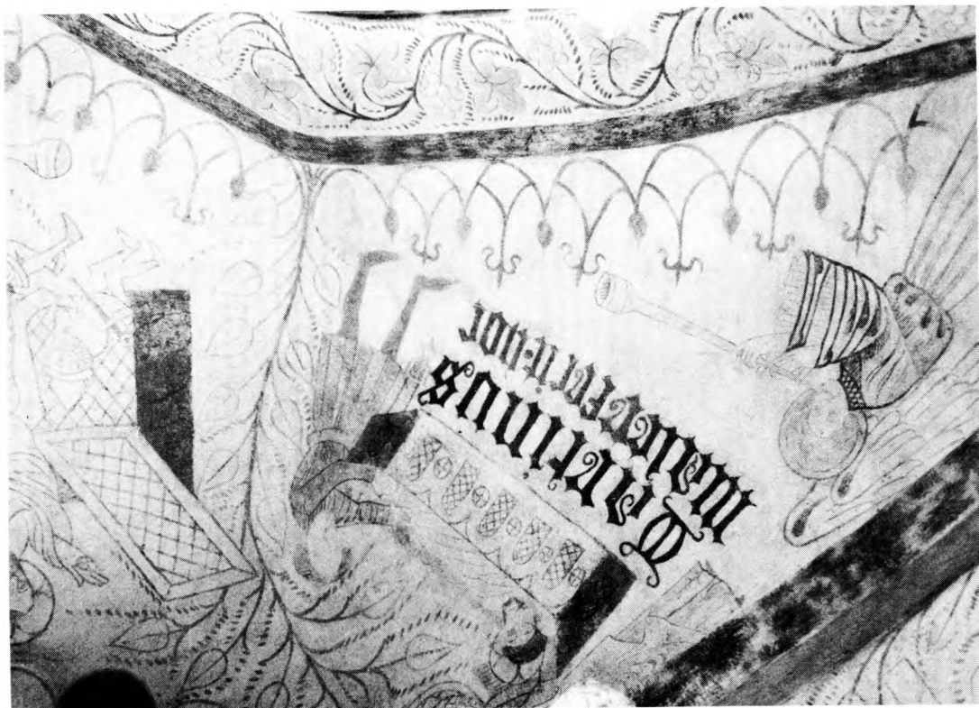
Foto 6: Midt i korets vestkappe læses: »Martinus Maler fecit hoc . . . Morten Maler gjorde dette.« Morten Maler har ubeskedent anbragt sin signatur under Jesus gravlægning. Gimlinge kirke (Midtsjælland) 1409.

falen er forlæg for kalkmalerier i Viskinge kirke (Nordvestsjælland) 6 .