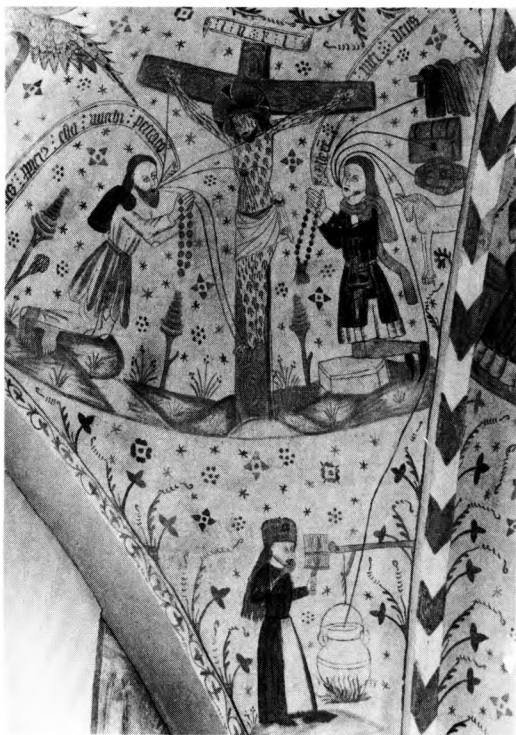
Foto 7: Her ser vi scenen rig/fattig mands bøn, der kun males af Brarup-, Everlöw-, Elmelunde storgruppen. To personer ligger bedende foran den lidende Kristus. Deres tanker er illustreret ved streger. Den fattiges tanker går til Kristi 5 sår, mens den riges tanker går til verdslige glæder: klæder, pengeskrin, øllønder, hest og konen der tilbereder maden. Keldby (Møn) 1480-1500.

stilistisk, tematisk og ikonografisk undersøgelse.