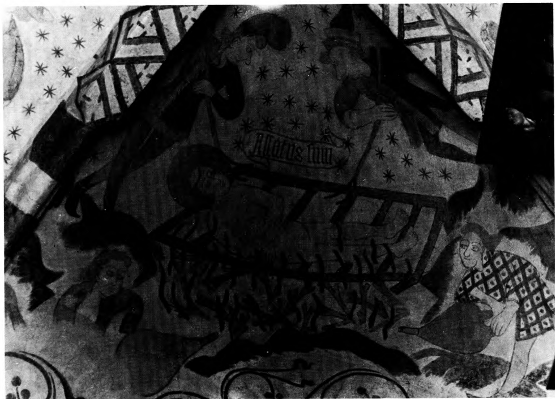
Foto 3: Helgenerne afbildes ikke kun i fredelige scener. Vi ser S. Laurintius liggende på sin rist. To ondt udseende bødler med stegegaffler rister ham over en sagte ild. To andre bødler holder ilden ved lige med blæsebølge. S. Laurentius udbryder: »Assatus sum . . . jeg er mør.« Sdr. Asmindrup (Nordvestsjælland) 1450–80.

og apsis, hvori menigheden ikke kom 4 . Ligeledes blev den side af triumfvæggen (muren mellem koret og skibet), der vendte mod menigheden dekoreret med kalkmalerier. Senere hen i gotikken (1300–1525) kom kirkegængerne i umiddelbar kontakt med kalkmalerierne, idet disse dels blev malet på de nybyggede hvælvinger, dels på kirkerummets vægge, søjler etc.