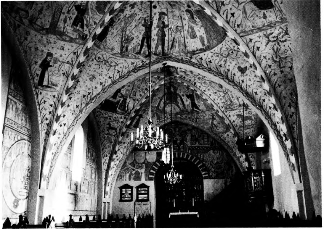
Foto 9: Keldby kirke på Møn. Billeder fra to perioder. Malerierne på hvælvingerne er malet omkring 1480, vægmalerierne er fra ca. 1325. Bemærk, hvorledes kirkens indbyggede hvælvinger tildækker den oprindelige kalkmaleriudsmykning på væggene.

nu Madonna's billede . . . malet højt på muren under hvælvingen, hvor det ej er blevet overkalket . . .«. Således skriver H. C. Andersen i 1842 («En digters bazar» p. 119). Da kalkmalerierne i løbet af 1600-tallet forfaldt, blev de hvidtet til således, at næsten alle danske kirker i begyndelsen af 1800-tallet stod hvidkalkede. I nogle ganske få kirker f.eks. Sulsted og Nørre Saltum har kalkmalerierne stået udækket, siden de udførtes i middelalderen.