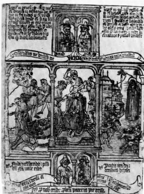
Foto 5: På billedet ses en side fra en fattigmandsbibel – en bloktryksbog. I midten har man en nytestamentelig scene, her torne-kroningen, der er omgivet af gammeltestamentlige motiver. Biblia Pauperum (Budapest 1967).

De fleste middelalderlige kalkmalerier i Danmark er malet efter forlæg. Ligesom hovedparten af anden kulturpåvirkning stammer også forlæggene fra det sydlige Europa. De kunstneriske forlæg er f.eks. altertavler, træsnit og især billedbibler, hvor den første »fattigmandsbiblen« (Biblia Pauperum) dukker op i det 13. århundrede og hurtig spredes over hele Europa. Henimod 100 fattigmandsbibler er idag bevaret. Forlæggene følges dog