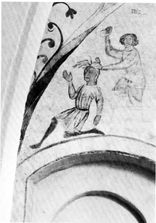
Foto 4: Over den nu tilmurede udgangsdør i Vester Broby kirke ses brodermordet – menneskets første ondskabsfulde handling. Cain ihjelslår Abel så blodet sprøjter fra hans hoved. Billedet har påmindet middelalderbonden om, at han nu træder fra det hellige kirkerum ud i den syndige verden, hvor ondskaben hersker. Vester Broby kirke (Midtsjælland) ca. 1400.

dog måske nok males noget, som er taget af verdslige historier, især hvis det indeholder lærdom og undervisning til tugt og gode sæder 5 .