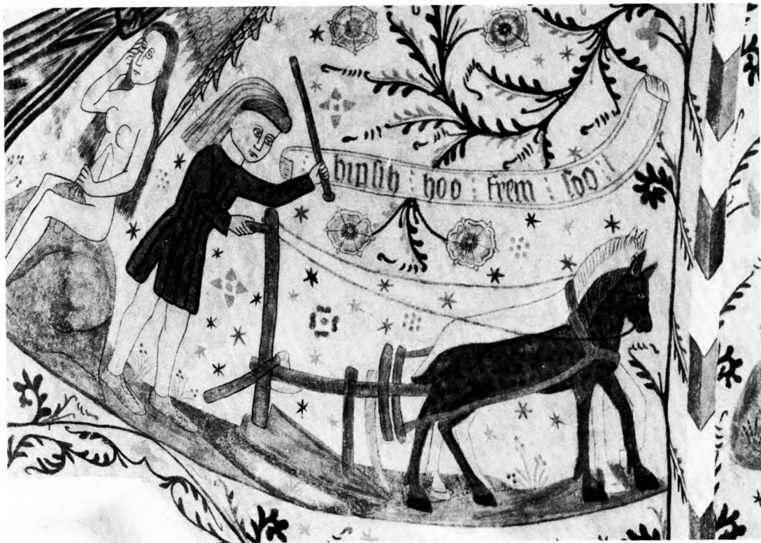
Foto 13: Efter uddrivelsen af Paradisets have skulle Adam og Eva selv tjene til livets ophold. Adam er afbildet som en middelalder bonde. Her er han i færd med at pløje. Elmelunde kirke (Møn) ca. 1490.