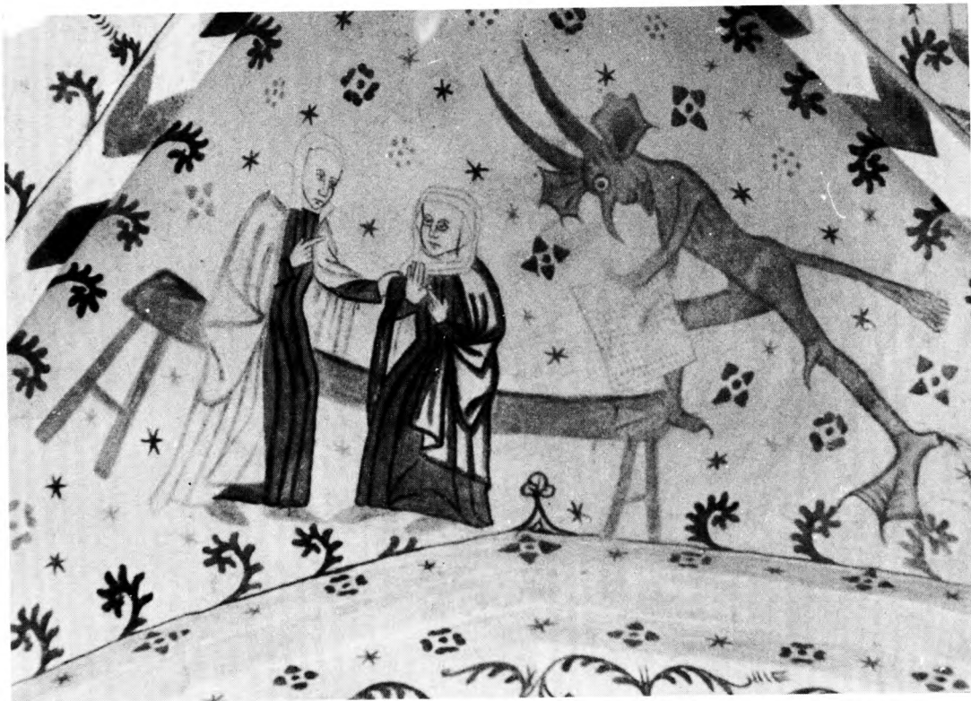
Foto 11: To koners skvadren under gudstjenesten hidkalder en djævel, der straks fører det til bogs. Djæveln vil senere bruge sine optegnelser imod kvinderne, nemlig ved regnskabets time på dommens dag. At påbudet om ro under gudstjenesten virkelig havde relevans fremgår også af det overleverede prædikenmateriale, hvori der findes klager over, at menigheden sover eller snakker under de kirkelige handlinger. Fanefjord kirke (Møn) 1480–1500.

manske periode tiltænkt Guds ære, jomfru Maria og andre helgener eller henvendt til præsten.