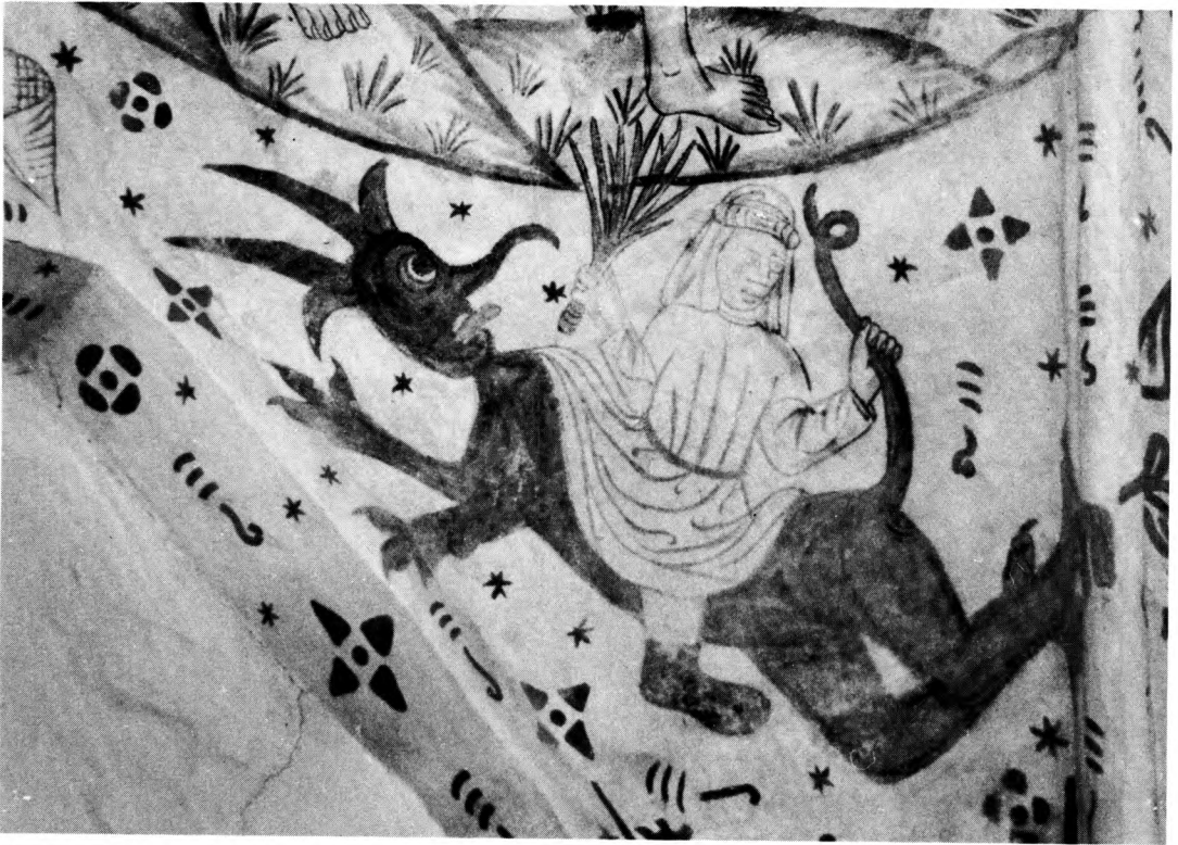
Foto 12: En kvinde rider overskrævs på en djævel, som hun pisker bagi. Maleriet er sandsynligvis ment som en påmindelse til middelalderens kvinder i sognet om at tage sig i agt for Satan, fristeren. Billedet er – ligesom det foregående – anbragt i umiddelbar relation til kvindernes dør i nordvæggen. Åstrup (Falster) ca. 1480.

en genstand, dens funktion og forekomst). C) INDIREKTE VIDNESBYRD, (forestilingsverden eller kunstneriske og kulturelle forbindelser) samt til oplysninger angående stifterbilleder og heraldik.