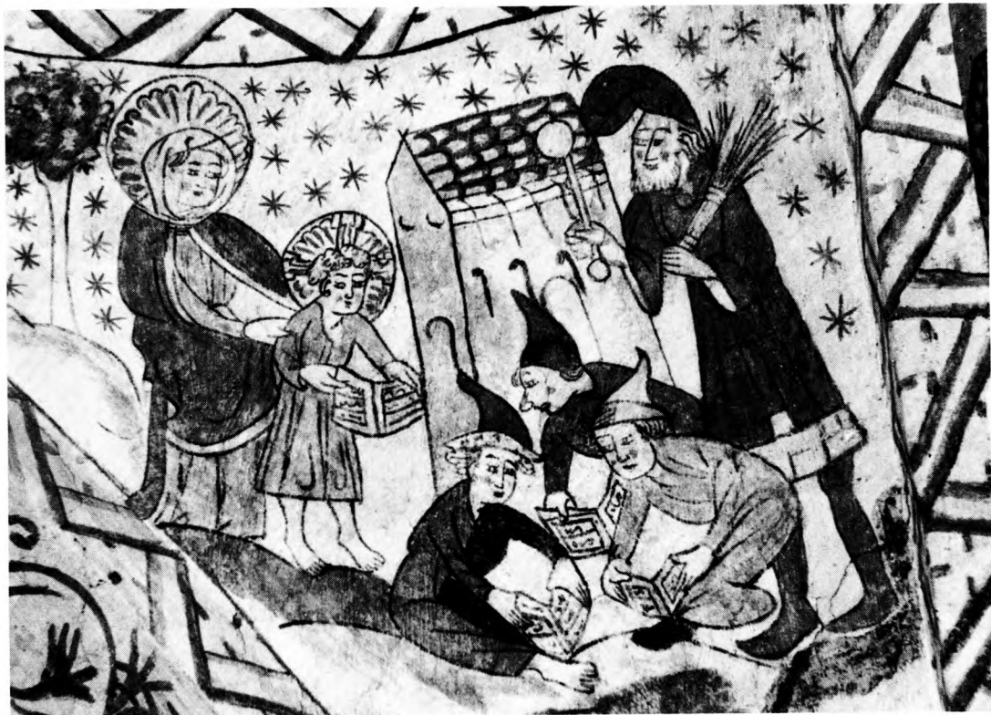
Foto 1: Det lille Jesus barn følges til skole af Maria. Drengene – med nissehuer på hovedet – overhøres af skolemesteren, der i hånden har de velkendte straffereds-kaber: riset og feren. Tuse kirke (Nordvestsjælland) 1450–80.

værksteder er metodiske forhold, der spiller en afgørende rolle i denne forbindelse. Disse forhold vil indgående blive behandlet senere.