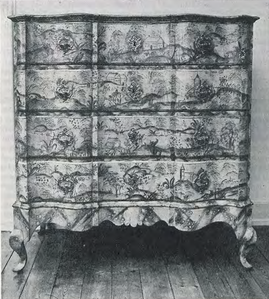
Rokoko-dragkiste fra 1745, bemalet med blå kineserier, fra herregården Hesselmed i Al sogn.