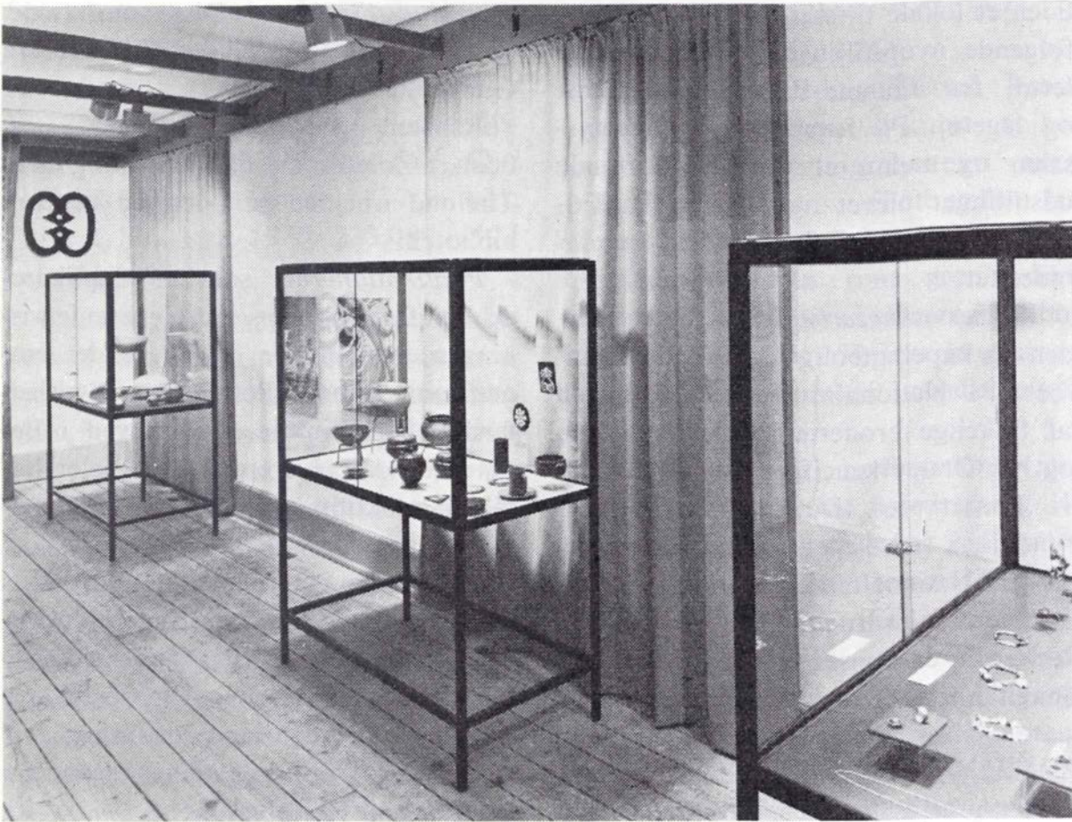
Lolland-Falsters Stiftsmuseum. På første sal i hovedmuseet er der nu indrettet to sale til skiftende udstillinger. De blev første gang taget i brug i nov. 1971 til udstillingen »Ghana«.