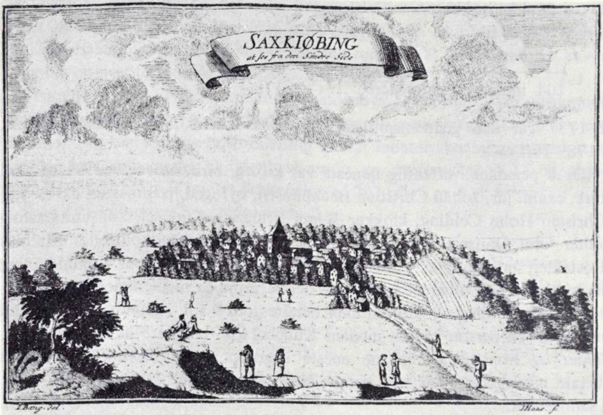
Sakskøbing – gengivet efter Erich Pontoppidan: Den danske Atlas , bd. III, 1767.