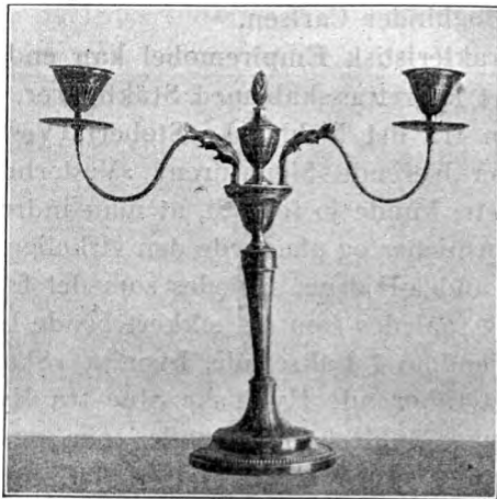
Fig. 3. Sølvvarmstage. København 1790.

Af andre Sølvsmedearbejder er der erhværet adskilligt Bordtøj. Sølvbeslag har en Pibekande af Træ, et Bødkerarbejde med udskaarne, slyngede Navnetræk fra Tiden c. 1700, maaske gjort i Norge, men sidst kommende fra Faaborg. Et Sølvbæger med graverede Barokblomster bærer københavnske Stempler fra 1709 (Mester: Villads Frandsen), et Sølvlaag er ligeledes københavnsk Arbejde, fra 1746 (Mester: Axel Krøyer). Hovedstadsmærker har