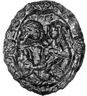
Fig. 5. Aftr. af Kageform. 1665.

Af de engelske Fajancer, som var de seneste danske Fabrikkers Forbilleder, er der især erhværvet en Del Exemplarer med paatrykte danske Prospekter, navnlig et Kaffe- og Testel med københavnske Billeder, fabrikeret af Sewell c. 1825. Lidt yngre er et Fad med »East view of the town Charlotte Amalie in the island of St. Thomas« samt et Par Tallerkener med Billeder af »Mr. Kjær's residence & observatory«, sikkert ligeledes paa en af de tidligere dansk-vestindiske Øer.