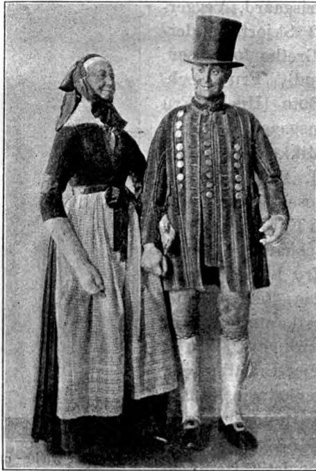
Fig. 10. Mands- og Kvindedragt fra Rosnæs.