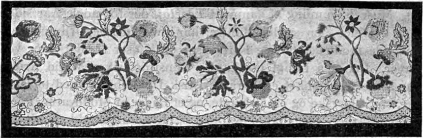
Fig. 7. Uldgarnsbroderi paa Sengetæppe i Rococostil.