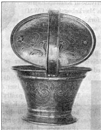
Fig. 4. Torvespand af Messing. 1782.

Blandt andre Bord- og Køkkensager kan fremhæves en større Samling Køkkentøj af Kobber og Tin, stammende fra Herregaarden Gammel-Estrup, samt flere enkelte Genstande: en nydelig,