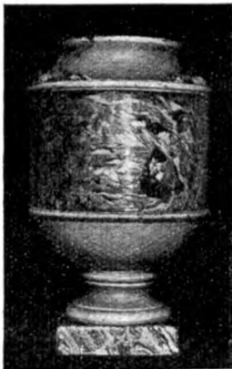
Fig. 6. Potpourrivase af Kastrup Fajance.