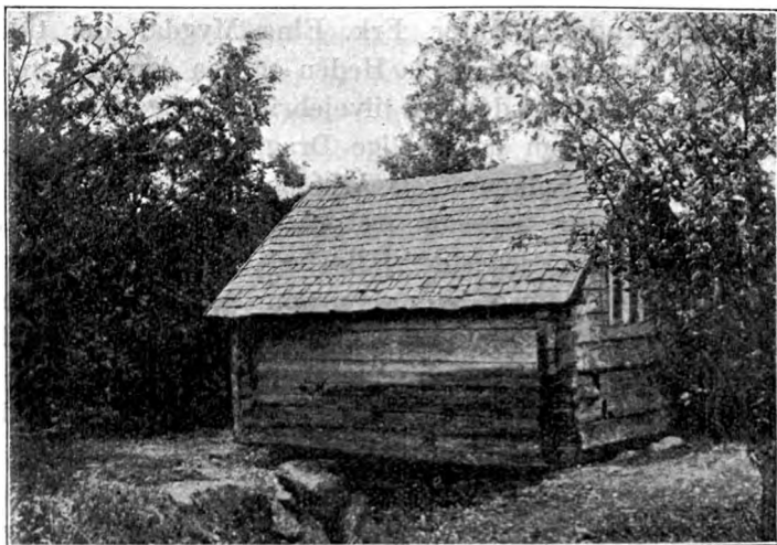
Fig. 1. Skvætmølle fra Åhylte.

Hvad Frilandsmuseets Bygninger angaar, har Rejserne ikke tilført Frilandsmuseet større Erhvervelser. Prisforholdene har jo været lidet gunstige for Indkøb og Flytning af større Bygninger.