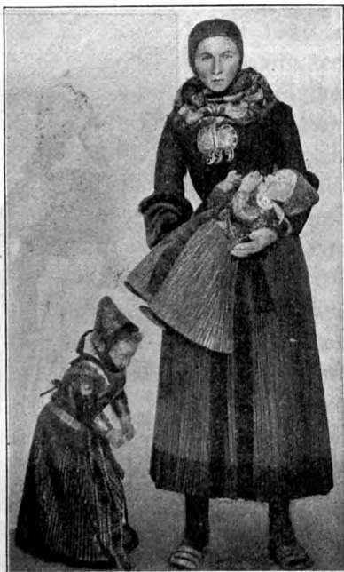
Fig. 9. Kirke- og Barnedragt fra Hollandsk Amager.