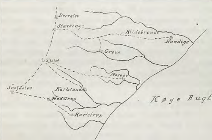
Fig. 1. Vandskelsveje i Tune Herred, Sjælland.

Tid er lagt tværs over Vejene, som Regel ved Enderne støttende sig til Søer og Lavninger, som frembød Hindringer for Hærafdelingers Fremtrængen. Langs den omtalte Oksevej i Jylland findes saaledes, foruden Danevirke, Margrethediget lige Syd for det Sted, hvor Vejen passerer Vandskellet mellem Skjern Aa og Guden Aa og Kong Knaps Dige tættere op imod Viborg. Disse gamle Befæstningsanlæg angiver, hvor der har været Færdselsveje, som man har villet forsvarer, og det, at de findes paa Hovedvandskellene, angiver, at disse har været Færdselsveje.