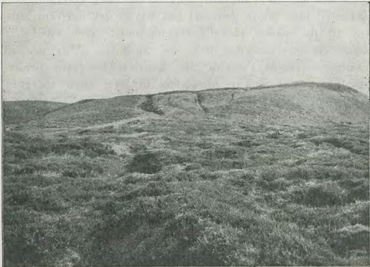
Fig. 2. Vejspor paa Nordsiden af Hannæs, Hanherrederne.

Hannæs, hvor Vejen i sin Tid har maattet op over Bakken mellem den nu inddigede Tømmerbyfjord og en nu udtørret Sø for at naa over Hannæs til Feggesund og videre til Mors (Fig. 2). Men selv hvor der bliver pløjet, kan Vejsporene navnlig paa Bakkeskraaningerne, og hvor Jorden er let og sandet, saa at Regnvandet hjælper til at holde Sporet aabent og maaske gøre det dybere, blive til dybe Hulveje, som først sent pløjes ud.