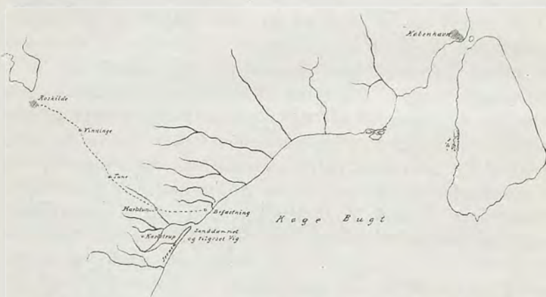
Fig. 6. Vejforbindelse mellem Roskilde og Landingssted ved Køge Bugt.

Saxo fortæller hvorledes Roskilde blev angrebet af Venderne, der gik i Land Øst paa i Sjælland; det har naturligvis været i Køge Bugt, og da en Vandskelsvej fører fra Karlslunde Strand over Tune til Roskilde (Fig. 6), forstaar man let, at der ogsaa paa dette Sted ude ved Vandet er fundet Levninger af en gammel Befæstning, som har skullet dække Roskilde mod Angreb fra denne Side, Her har der antagelig ogsaa været et godt Landingssted, inden Vigen ud for Karlstrup forvandlede til de nuværende Moser, ved at Klittangen, Jernen, fra Syd voksede frem og lukkede Munden. Maaske er det denne Lukning, der har gjort det umuligt mere at have Vagtskibe liggende i