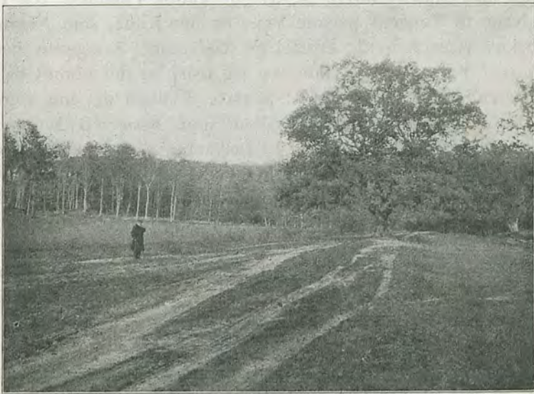
Fig. 4. Gammel Strandvej i Egebæksvang, Nordsjælland.

Langs Køge Bugt, hvor den gamle Køge Landevej har gaaet ude langs Vandet og stadig benyttes som Vej fra København til Hundige lige Syd for Lille Vejleaa, kan man ogsaa længere mod Syd finde Strækninger af den gamle Vej, der er ret velbevarede; men den meget stærke Villabygning paa denne Strækning i de senere Aar vil antagelig faa alle Spor her udslettede inden alt-