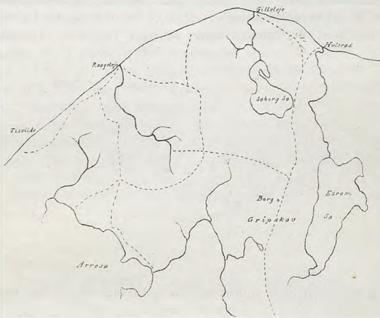
Fig. 5. Gamle Færdselsveje i Nordsjælland mellem Arresø og Esrom Sø.

meget læres langt tydeligere, end man kunde læse det af en Bog. Man vil f. Eks. pludselig forstaa, hvorfor man midt i den store Gribskov i Nordsjælland kan finde en ret stor Borgplads, thi Kortet (Fig. 5) viser, at den gamle Hovedfærdselsvej fra Nakkehoved og Landingsstederne ved Mundingerne af Søborg Sø Afløb og Esrom Aa, Gilleleje og Hulerød, har fulgt Vandskellet ned gennem Gribskov, og at Borgen netop her havde en ud-