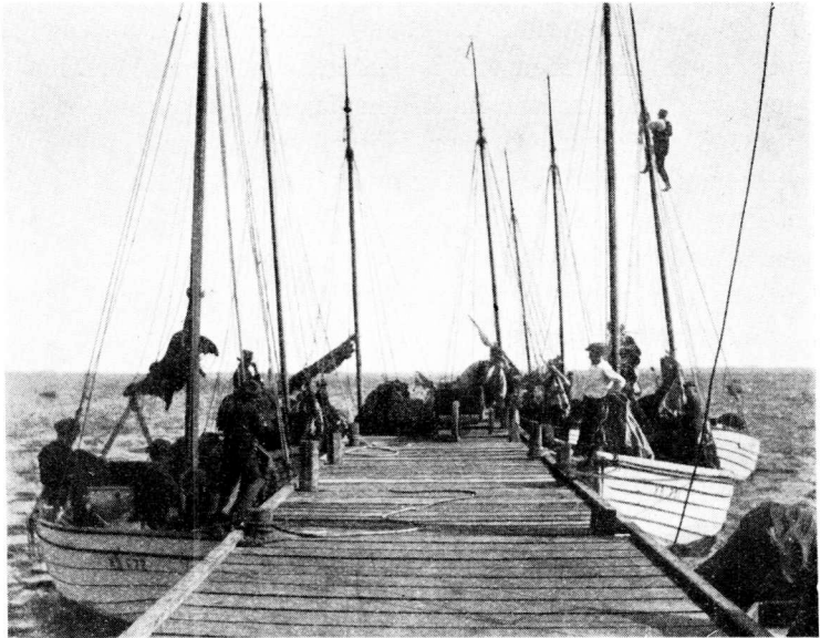
Fig. 2. Bæltsbaade ved Anløbsbro, Reersø. Den gamle, sejldrevne Bæltsbaadstype til Sildefangst med Drivgarn har nu ganske maattet vige for det mekaniserede Fiskeris Kuttere.