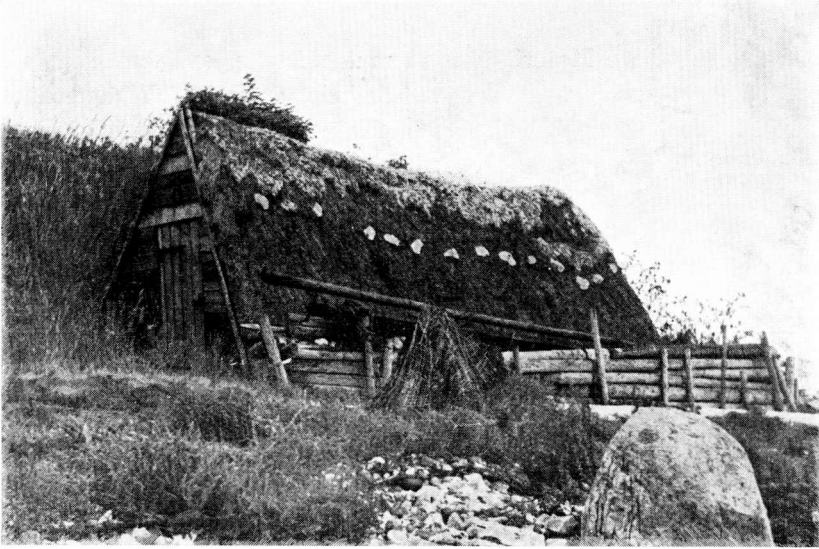
Fig. 3. Redskabshytte fra Midskov, Hindsholm. Saadanne primitive Hytter til Opbevaring af Sejl og Garn var tidligere almindelige ved mange Fiskerlejer. Nu er de næsten overalt borte.