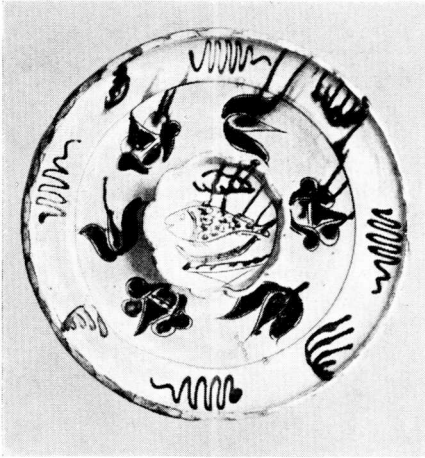
Fig. 5. Fiskefad med Begitning og grønne og brune Farver. Diam. 30,7 cm. »Den gamle By«.

jævnere Befolkning har delt Smag med Bønderne — begge Dele har vel været Tilfældet. Fra det 18. Aarhundrede findes der i Østjylland talrige Fade, som almindeligvis uden nærmere Begrundelse henføres til Gjern Hrd.s Produktion; Prøver herpaa er vist Fig. 5—6. Men i hvert Fald eet Arbejde kan med Sikkerhed henføres til en Købstadpottemager. Det er gengivet Fig. 7. Det er et stort Fad, beregnet til at hænge paa Væggen som Dekorationsstykke i Lighed med en foregaaende Generations Platter eller for at vælge et mere træffende Sidestykke de talrige »Makkum-Fade« fra Samtiden, hvis Gennemboringer i Fodranden viser, at de ogsaa har været beregnede paa at hænge op.