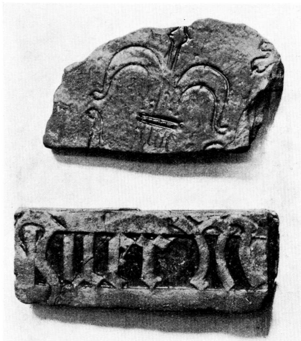
Fig. 1. Gravfliser fra Adslev Kirke, Hjelslev Hrd. »Den gamle By«.

er fundet i Aaby Kirke (Hasle Hrd.) med Blyglasur 5) . Gravfliser af denne Art kendes ogsaa fra andre Kirker i denne Egn, fra Maarslet Kirke (Ning Hrd.) og Adslev Kirke (Hjelslev Hrd.), begge Steder med grøn Blyglasur. (Fig. 1). Om disse Fliser er