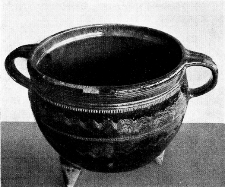
Fig. 3. Mesterstykke fra Odense. Diam. 36 cm. »Den gamle By«.

Grydens Bestemmelse, blev opgivet ved Købet og fremgaar desuden af Lavets Segl, der er aftrykt i Ler ved den ene Hank og brændt og glaseret sammen med Potten, og af Maalene, der svarer til de Fordringer til Mesterstykket, der blev stillet af Cancelliet 1823.