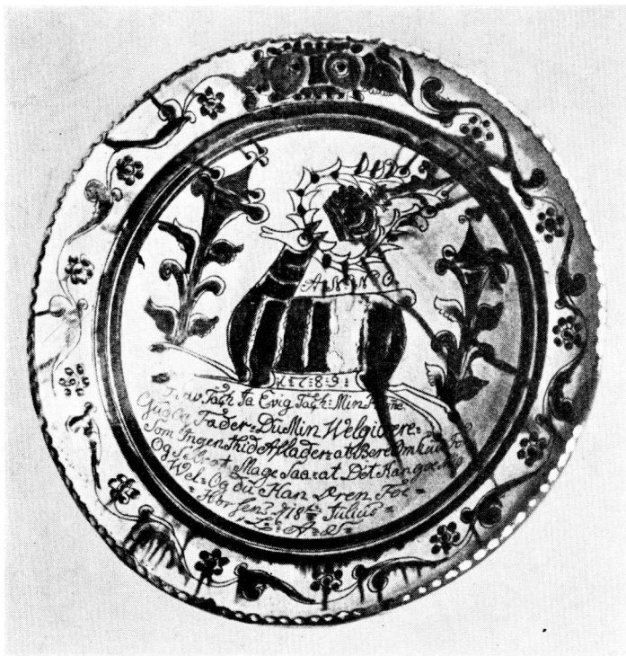
Fig. 7. Fad, sign.: Horsens 18. Juli 1789. Begitning og grønne og brune Farver. Diam. 39,5 cm. »Den gamle By«.

Fadet er udført som de andre, oven paa den begittede Overflade er Dekorationen udført dels med grøn og brun Glasur, dels ved Indridsning, saa den brune Bund kommer frem. Det har en Diam. af 39,5 cm. Inden for Rankeborten langs Randen ses en løbende Hjort med en Krone mellem Takkerne, paa hver Side flankeret af et ornamentalt Træ, desuden findes Indskriften: