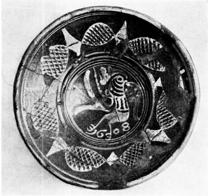
Fig. 8. Fad, dat. 1608, Jordfund fra Aarhus. Med Dekoration i Pibeler. Diam. 29 cm. »Den gamle By«.