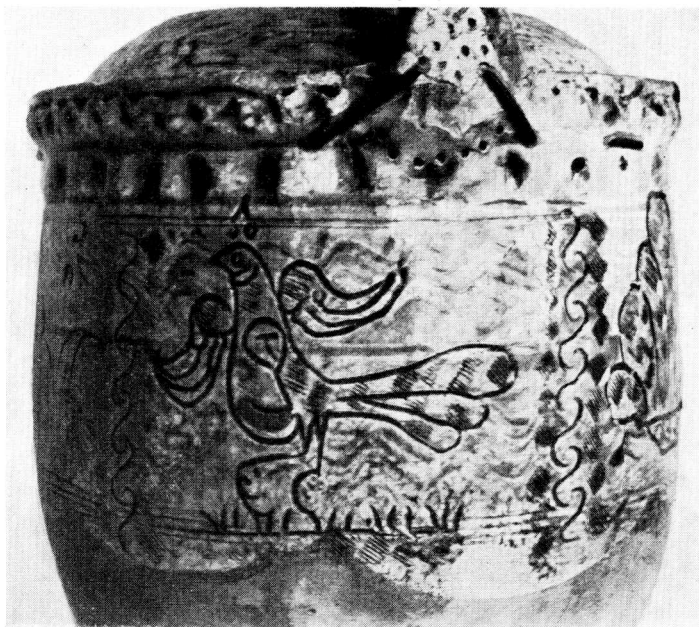
Fig. 9. Enkelthed af Barselpotte. »Den gamle By«.

og senere modtaget visse Paavirkninger. Begitningen er næppe tænkelig uden den hvide Tinglasur, som den efterligner. Maaske kan en saadan Indflydelse ogsaa eftervises. Fig. 8 viser et Fad med Dekorationer i Pibeler og med Blyglasur, fundet paa Mejl-gade i Aarhus ved en Gaderegulering. Det er dateret 1608. Særlig interessant i denne Forbindelse er Fuglefiguren i Midten. Den genfindes maaske paa en Barselpotte, Fig. 9. Kæden af omvendte S-Led henfører det sidste Stykke til Gjern Hrd. ca. 1850, og ved at paakalde stor Velvilje er det maaske muligt at skimte en Forbindelse mellem de to Motiver. Randborten paa det ældste Fad er maaske optaget fra de importerede, drevne »Daabsfade« 37) af