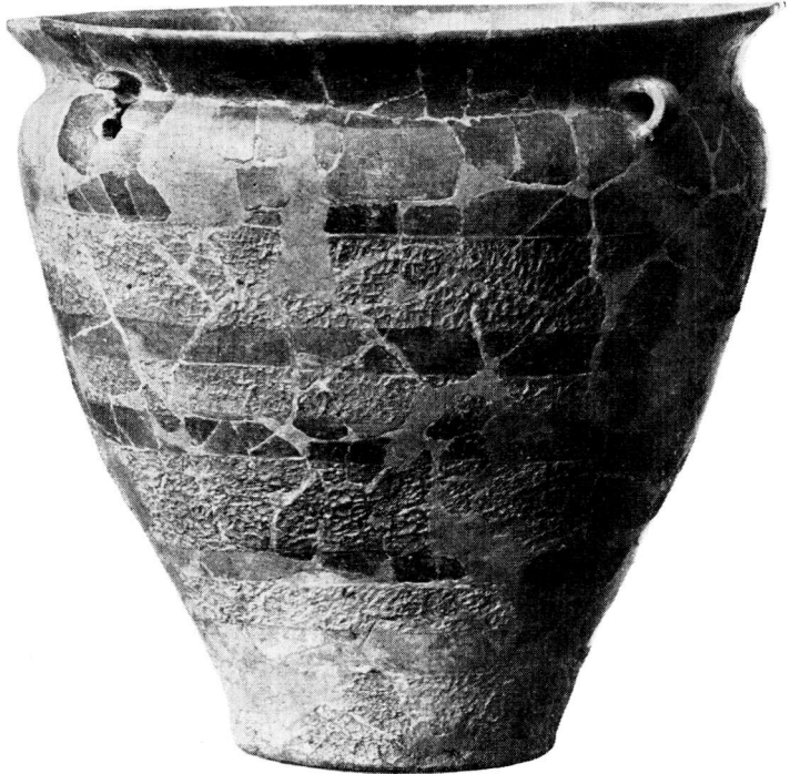
Fig. 2. Krukke med afvekslende glatte og ru Bælter, fra Kraghede-Gravpladsen. — 1 : 5.

Af største Vigtighed for Forstaaelsen af den keltiske Indflydelses Styrke allerede i vor tidligste Jernalder vilde det være, om