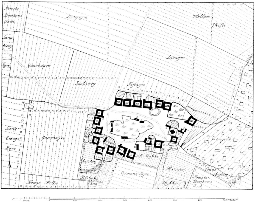
Fig. 4. Hejninge Bykærne. Efter Kort fra 1768.

Skema for Vejsager Mark. Paa den øverste Halvdel anføres samtlige Gaardbrugeres Navne efter Opmaalingsprotokollen fra 1768, saaledes som disse findes anført foran i saavel Opmaalingsprotokollen som i Taksationsprotokollen. Rækkefølgen er regnet fra den østligste Gaard ved Gadens Sydside og i Solens Omløbsretning. Lodret findes Rubrikker for samtlige Aase med deres Benævnelser. Under hver Aas angives, hvorfra Opdelingen er begyndt: n—s fra Nord til Syd; o—v fra Øst til Vest. Desuden anføres, hvilket Agernummer de enkelte Gaardbrugere benyttede indenfor Aasen. Den nederste Halvdel af Skemaet har jeg udført paa den Maade, at Gaardbrugernes Navne opstilles i den Rækkefølge, der er anvendt under Eng- og Mosetakseringerne i 1682. I Rubrikkerne for de enkelte Aase har jeg saa ud for de respektive Gaardbrugeres Navne anført vedkommende Løbe Nr. i Ager-rækken. Saafremt man beholdt Markbogens Oplysning om, hvor-