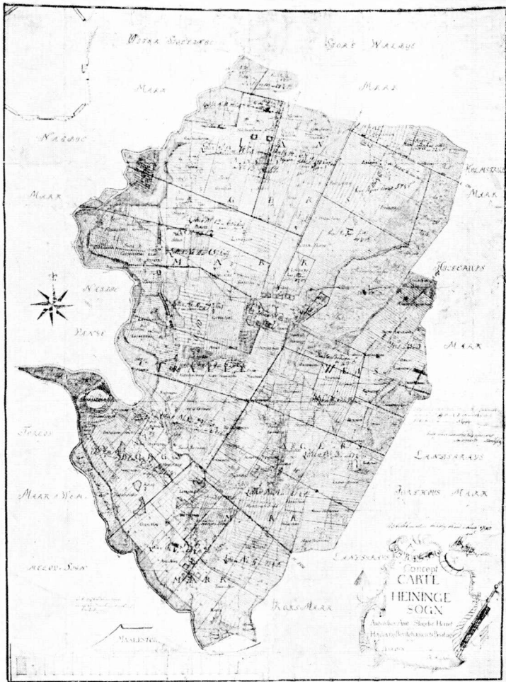
Fig. 1. Hejninge Bymarker for Udskiftningen. Efter Kort fra 1768.

maalingen i 1768 kan ses paa vedføjede Fotografi af to af de i Matrikulsarkivet beroende Kort (Fig. 1—2), der viser Forholdene i Marken 1768. Det ene Eksempel (Fig. 2) viser tillige den i Aaret 1781 af Landinspektør Ehlers foretagne Udskiftning af Byen. En Genpart af den i Forbindelse hermed afholdte Landvæsenskom-