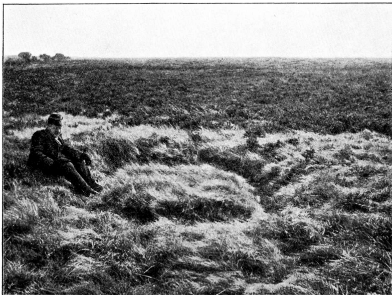
Fig. 1. Pinsebød i Paabøl Hede, Nr. Horne Herred.

Udførligere Oplysning om Pladsens Udformning giver følgende Beretning: »En gammel Mand i Lørslev (Ugilt Sogn, Vennebjerg H.)