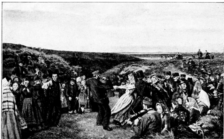
Fig. 2. Hans Smidths Maleri: Pinsefest paa Heden.

Vi skal nu betragte en anden Form for Gildespladser i Fri-luft, de af Diger indfattede Dansepladser. Ogsaa disse kan det være vanskeligt at tyde, naar man træffer dem ude i Terrainet, og de forveksles let med gamle Folde, ligesom man vel ogsaa