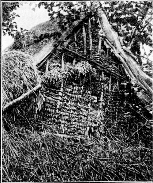
Dukket Gavl fra Fulden Nord for Horsens Fjord.

Det vil være af den største Betydning at faa udredet, hvor i Landet denne Tækkemaade har været brugt, selv om man blot