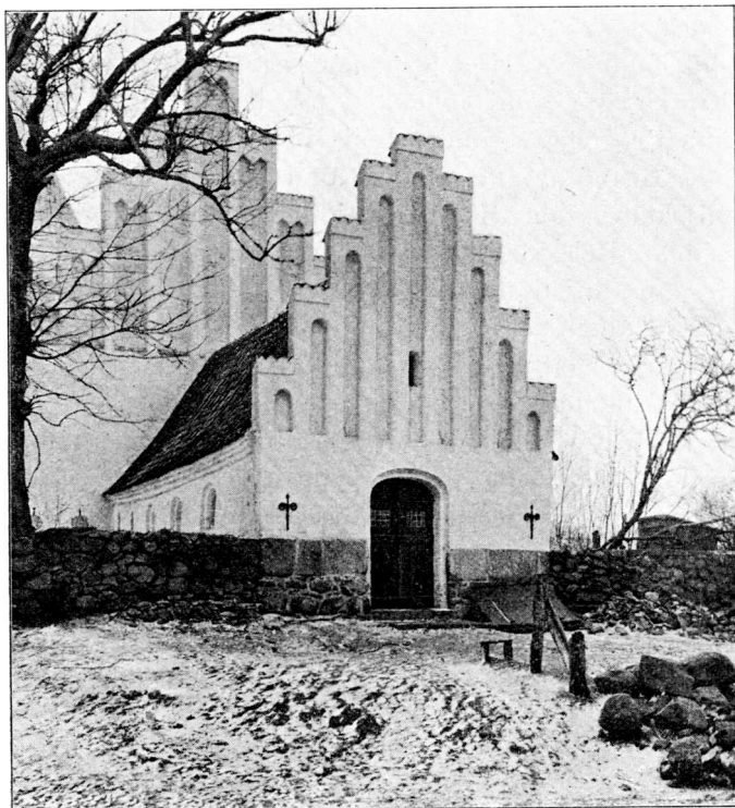
Hospitalet i Voldum.

Udgravninger er iværksatte paa Tomten af Ømkloster , hvor