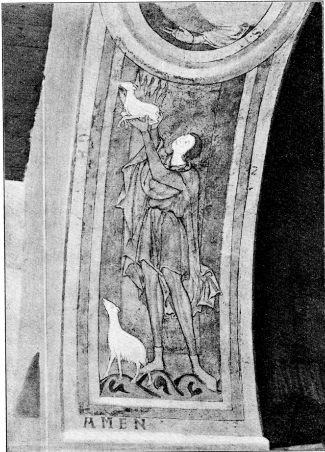
Abels Offer. Kalkmaleri i Vilslev ved Ribe.

Billede paa Korbuens Sydparti, forestillende Abel, som ofrer Lammet, at opfatte som et Symbol paa det kristelige Messe-