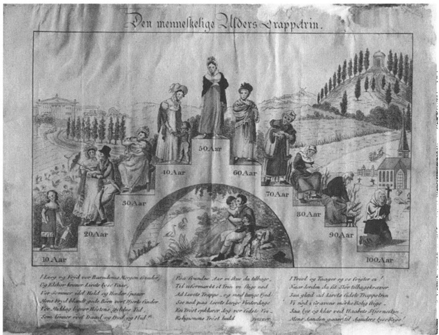
Den menneskelige Alders-Trappetrin. En alderstrappe, der viser kvindelivets stadier, koncentreret omkring familien.

De ikonografiske fremstillinger af livsaldrene med livets uundgåelige kontinuitet og forandring var indskrevet i en abstrakt talmæssig orden og tog ikke udgangspunkt i erfaringer og oplevelser. De var således ikke spejlbilleder af en virkelighed, folk kendte, men i kraft af deres gentagelse gennem århundreder, forandrede og formede de almindelige menneskers forestillinger om det normale livsforløb.