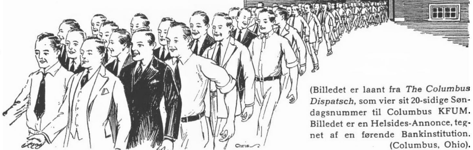
(Billedet er laant fra The Columbus Dispatch , som vier sit 20-sidige Søndagsnummer til Columbus KFUM. Billedet er en Hellsides-Announce, tegnet af en førende Bankinstitution. (Columbus, Ohio).

Hundreder og atter Hundreder af Dreng i den mest paavirkelige Alder sendes igennem KFUM og kommer ud derfra som unge Mænd, vaagne, virksomme og med et tjenende Sind. De kommer ind i Foreningen i den Alder, da Grunden lægges for det senere Liv.