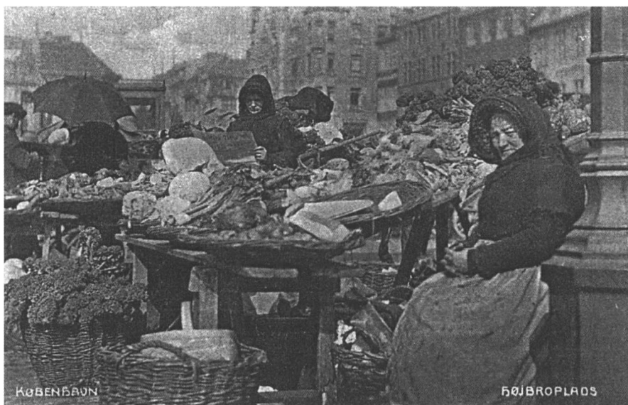
Torvehandel med grønsager på Højbro Plads i København (Postkort fra ca. 1900). De, der som blomsterkonen her, solgte fra faste stader, måtte ikke råbe med varerne. Det måtte kun de omvandrede sælgere.

Og hans råb er en forudsætning for den måde, han sælger sine varer på. Når han holder op med råberiet, må han enten slå sig ned med et fast stade på et befærdet sted, eller han må give sig til at stemme dørklokker. De fleste frugthandlere valgte den første løsning, skærslipperne den sidste.