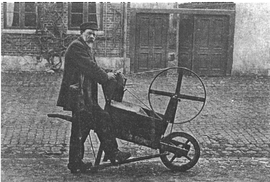
Sliber-Jens fra Nordsjælland (postkort fra før 1920). I ældre tid gik skærsliberen rundt med sin sliberbør, men i nyere tid var børen udskiftet med en cykel, og senere igen kunne slibestenen være motordrevet.

Gaderåbet er ét med gadehandlerens salg ved trækvognen. Den bruges kun dér. Gadehandleren går ikke hjem om aftenen og underholder kone og børn med sine råb, lige så lidt som han ville finde på at give dem til bedste på værtshuset i selskab med kolleger.