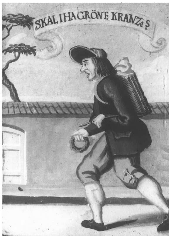
Kransesælger i København. Gouache lavet af ukendt kunstner i 1600-tallet.