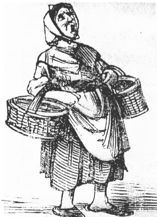
»Den skønne Helene« vignet fra forsiden af skillingsvisetryk fra Julius Strandbergs Forlag 1866.

med brænde. Skorstensfejeren anmeldte med råb sit besøg næste dag, og skærslipperen tilbød at ordne »alle skærende instrumenter«.