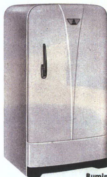
TYPE A 100 Rumindhold 105 Liter Leveres ogsaa til Indbygning