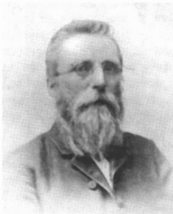
Iver Kristensen Holmgaard gengivet efter Konrad Understrup: Ørre Sogn s. 122.

det lune end den patos, der karakteriserer hans senere skuespil og digte.