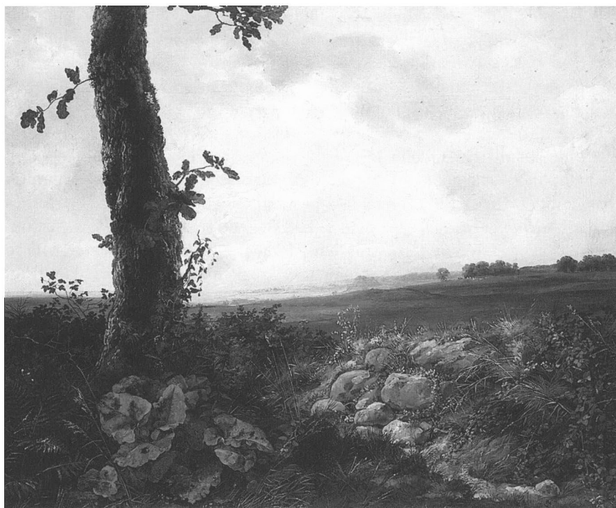
J.C. Dahls maleri giver et fint indtryk af det åbne landskab før udskiftningen, hvor landsbyer, hovedgårde og købstæder lå som øer i landskabet.

lega L.M. Wedels anvisninger om agerdyrkning, hvis målgruppe netop var landsbypræsterne. Risgærder var, ifølge Wedel, et bonde-fænomen »...især for dem, som ligger i fællesskab og ikke kan enes om andet« (13).