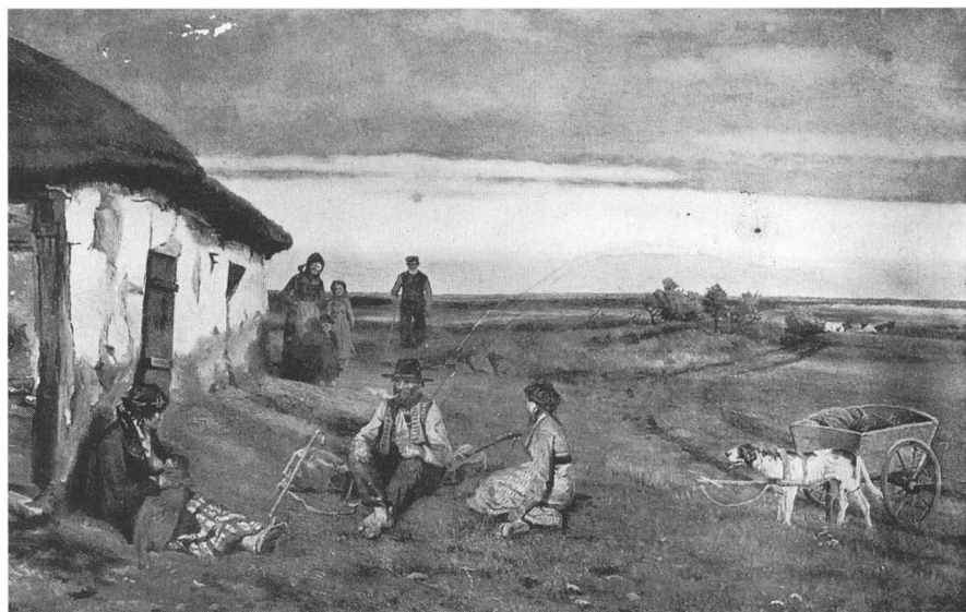
En omvandrende familie holder hvil ved en gård på den jyske hede. Billedet er malt af Hans Smidth, som i slutningen af 1800-tallet malede en række billeder af natmandsfolk og kæltringer. Hans Smidth var inspireret af St. St. Blichers fortællinger om denne befolkningsgruppe. En reproduktion af billedet findes på Frilandsmuseet.

af produktion af jydepotter, kalk, humle, uldforarbejdning osv. til salg til andre bønder gennem de såkaldte sektionmarkeder (27). Her var der tale om en biproduktion af varer, som bl.a. blev solgt til andre landsdele, hvor denne produktion ikke fandt sted. Denne forskning har vist, at nok var bønderne selvforsynende, men de købte også varer produceret i andre dele af landet (28).