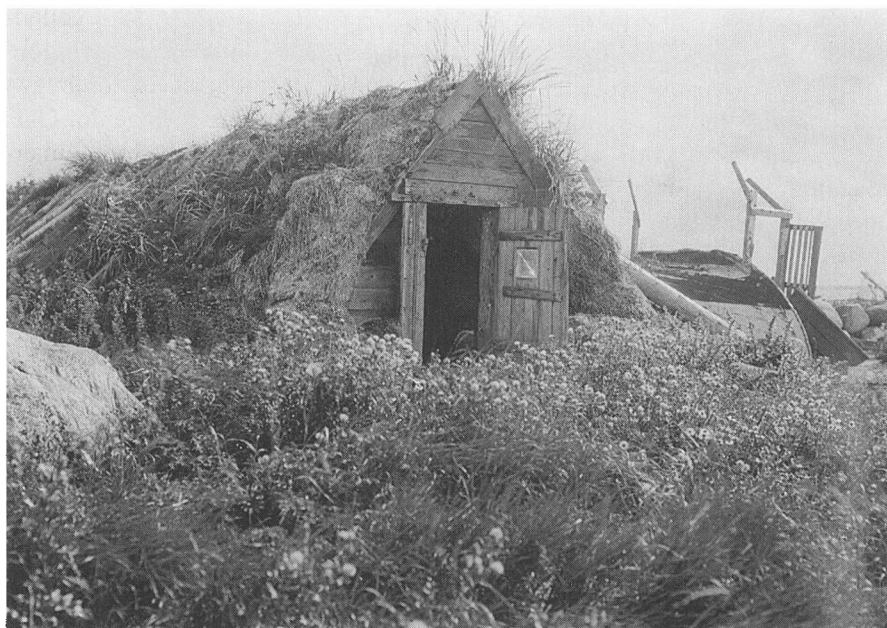
Tanghytten på Nordre Rønner, fotograferet af Achton Friis i august 1924.

hjemmefra. Denne gamle tanghytte, som måske har ligget der op mod et hundrede år, anvendes endnu, ikke som menneskebolig, men som et slags udhus, hvor der er rum til fyrmesterens høns, gæs og andet småkræ. Det kan ikke nægtes, at tanghuset efterhånden er kommet til at se noget medtaget ud« (16).