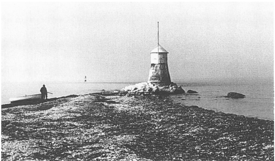
Sjællands Rev med redningsbåken, »Tårnet«, fotograferet ved lavvande den 30. april 1960. Yderst på revet skimtes fyret.

Båken er i dag placeret på et betonfundament, der er støbt oven på de store natursten, der findes på Yderrevet. Den består af en cylinderformet glasfibre krop med indgangsdør, og taget har form som en keglespids. Inventaret er det samme som tidligere. Fra »kommandobroen« på Gniben holder man øje med, om der er hejst flag på redningsbåken, hvorefter der hurtigt kan sendes en båd afsted. Efter spareforhandlinger i Forsvarsministeriet og Farvandsvæsenet er konklusionen blevet, at redningsstationen på Odden er nedlagt den 1. april 2000. Der har dog ikke været røster fremme om også at nedlægge båken, der har eksisteret som decideret redningsbåke siden 1863.