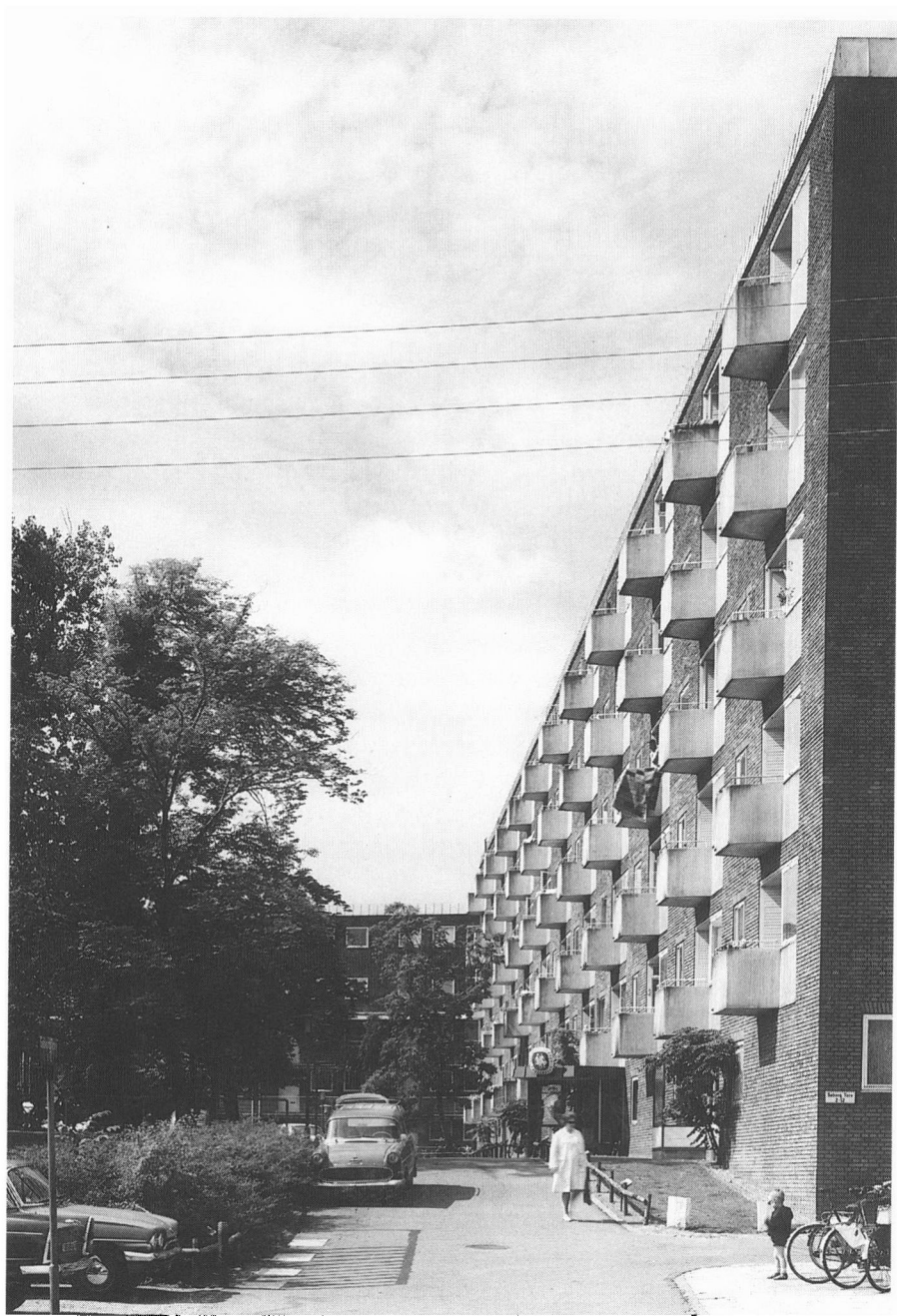
Kollektivhuse opførtes som etagebebyggelser. Høje Søborg ved indvielsen i 1951. I dag står bebyggelsen uændret.