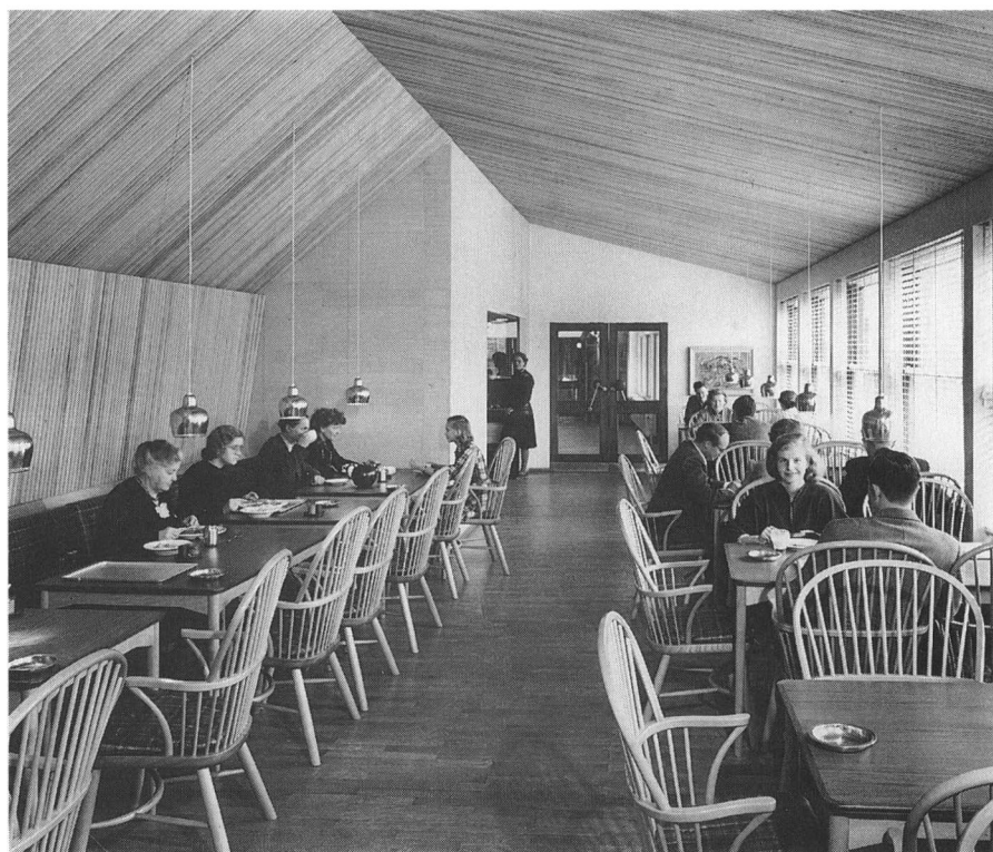
Restauranten var en rationel spiseordning for beboerne. Den er stadig møbleret med samme funktionelle indretning som i 1951.

grad ud fra et ønske om at bo kollektivt end ud fra det sociale sigte, som lå bag de svenske kollektivhuse.