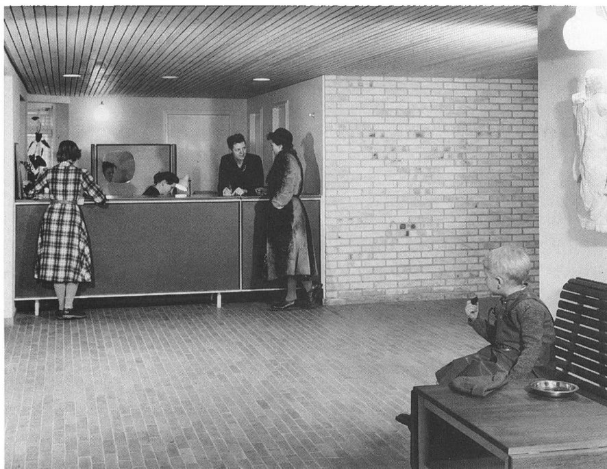
Receptionen blev i 1951 kaldt kollektivhusets hjerte. Den har fortsat en central placering i beboernes visioner for Høje Søborgs fremtid.

gerer fordi beboerne har brug for de specielle funktioner, der tilbydes. I familiekollektivhuset har den teknologiske udvikling overflødiggjort mange faste funktioner, fordi de er blevet mindre tidskrævende. Den generelle ned-sættelse af arbejdstiden gør også aflastning mindre nødvendig, og ligestillingen har medvirket til, at kvinden ikke udelukkende har ansvaret for hjemmet, som man gik ud fra i 1950'erne. Den økonomiske belastning fra pris- og lønudvikling samt skattetryk har ligeledes haft indflydelse på nedlæggelse af de faste funktioner.