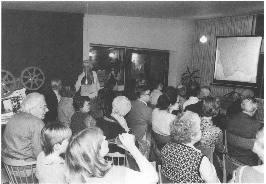
En velbesøgt foredragsaften midt i 1980'erne var en social begivenhed for beboerne.

beboer skulle aftage 15 middagsboner månedligt. Receptionen varetog stadig servicefunktioner, men rengørings- og vaskeriordning bortfaldt i slutningen af 1960'erne. I 1973 nedlagdes telefoncentralen, og alle lejligheder fik direkte telefonforbindelse. I stedet etableredes kiosksalg ved receptionen. I alt blev antallet af ansatte reduceret til omkring ti, og de ledige lokaler blev inddraget til nye formål bl.a. en opholdsstue i butikkens lokaler. Opholdsstuen erstattede rygerummet, der blev indrettet som spisestue til små selskaber. I opholdsstuen samles ofte beboere over en øl og en snak. De ældre beboere mødes ligeledes her i en hyggeklub til en kop kaffe og blødt brød en eftermiddag ugentligt.