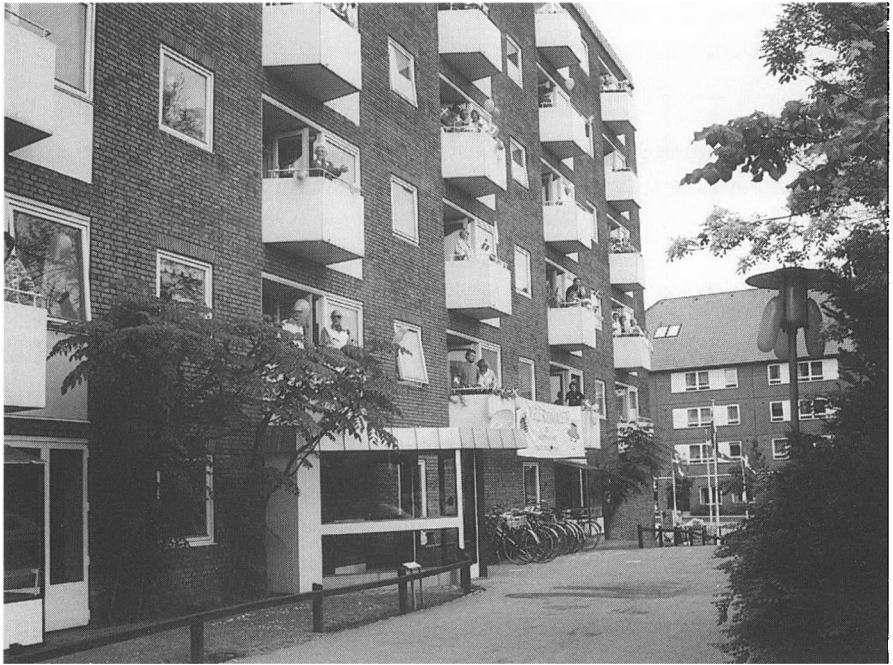
Høje Søborgs 40 års fødselsdag i 1991, som beboerne fejrede med et stort arrangement, der bl.a. bød på hornmusik og fest.

har en mere blandet social sammensætning, hvilket afspejler sig tydeligt i de uformelle relationer.