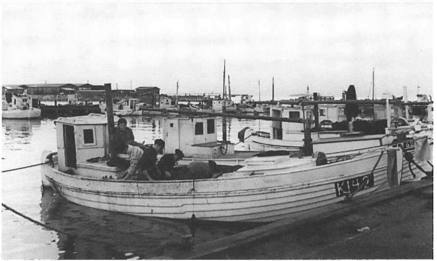
Fiskerne i Skudehavnen 1957. Som man også kan se på billede 1 er der kvinder om bord. Mens det i andre dele af landet har været mændene der stod for selve fiskeriet, har det været almindeligt blandt Skudehavns fiskere at tage deres koner med som besætning.

ændringer i Nordhavnsområdet. Først i midten af 60'erne, begyndte udviklingen at tage fart. Færgehavn Nord blev etableret nordøst for Skudehavnen, og den inderste del af Skudehavnen blev fyldt op. Samtidig fortsatte opfyldningen af området omkring 10-meter-bassinnet og i 1968 besluttede man sig for at etablere en containerterminal ved 10-meterbassinnet. Det betød, at fiskerne og de nærliggende sejlklubber skulle flytte og i 1969 blev de flyttet til den plads i Skudehavnen, som de beholdt indtil 1995.