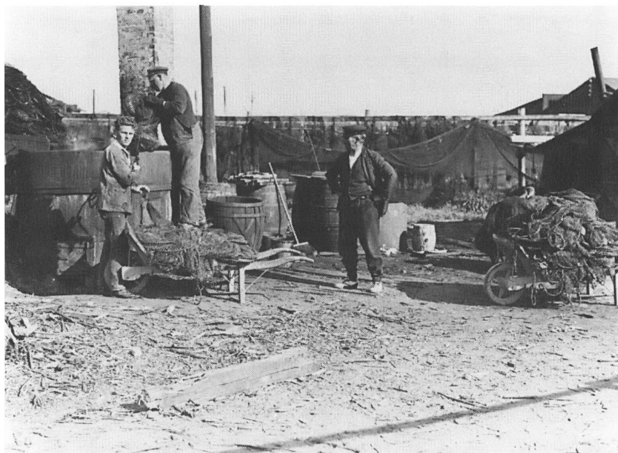
Barkning af ruser i fiskernes første skurby 1933. Redskaberne krævede meget vedligeholdelse og en stor del af fiskernes arbejde foregik i land. I baggrunden ses fiskernes stejleplads og deres primitive skure. Flere af skuerne flyttede med i 1940.