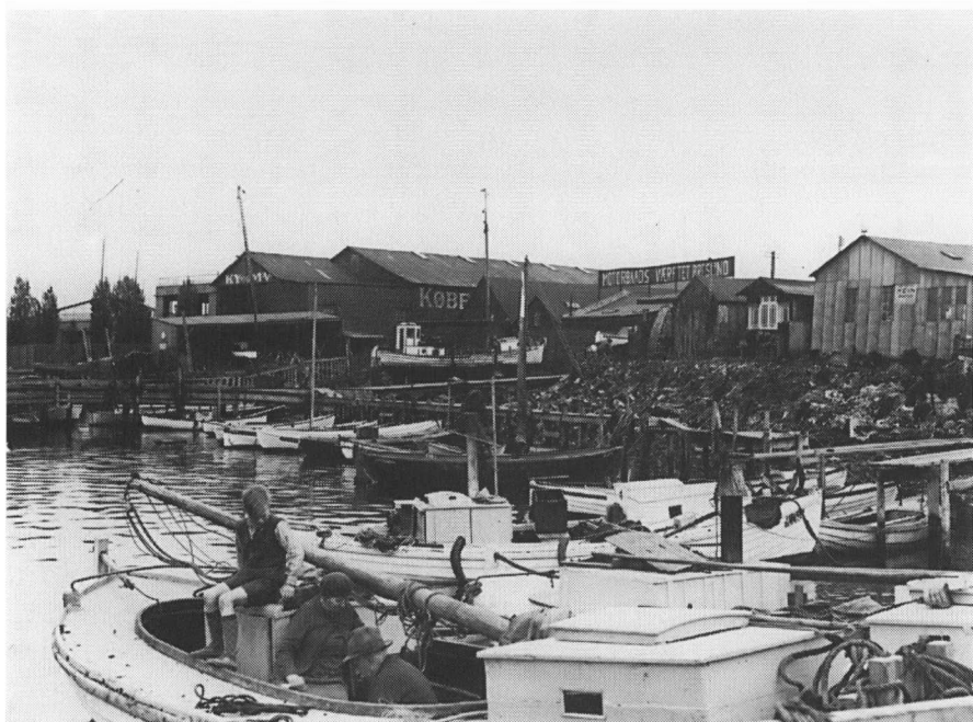
Fiskerihavnen ved Kalkbrænderhavnsløbet 1936. Masterne kunne lægges ned så man kunne sejle ind til fisketorvet, eller skyde genvej gennem Københavns Havn ned til Køge Bugt. I baggrunden ligger Københavns Yacht og Motorbaads Værft, som blev flyttet om i Skudehavnen sammen med fiskerne. Allerede på dette tidspunkt havde området omkring fiskerihavnen fået den karakter, der senere gjorde Skudehavnen til noget særligt. Fiskernes skure lå tilbagetrukket i land.

på baggrund af en kraftig stigning i skibstrafikken under Første Verdenskrig. Men allerede i 1921 måtte man indstille arbejdet, da skibsfarten løb ind i en krise. Man stod således med Skudehavnen og et nyt halvfærdigt dybvandsbassin, der ikke kunne tages i brug efter den oprindelige hensigt.