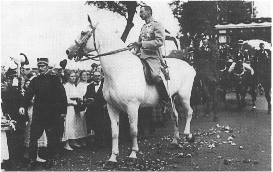
Kongen hilser på folkemængden ved Frederikshøj 10. juli 1920.

get regeringen. Striden stod bl. a. om Flensborg, som kongen ønskede indlemmet i Danmark, selvom et massivt flertal i byen var gået imod de danske ønsker, om byens tilbagevenden til Danmark ved afstemningen i februar 1920. Socialdemokratiet og Det Radikale Venstre erklærede kongens handlemåde for grundlovsstridig og fagforbundene varslede generalstrejke. Amalienborg Slotsplads vrimlede med demonstranter, der råbte »leve republikken« og »Ned med Christian« og en revolution syntes som et muligt resultat af krisen. Striden blev dog løst ved et kompromis hvor kongen d. 5. april 1920 udnævnte et forretningsministerium, godkendt af politikerne, der kun havde til formål at udskrive valg.