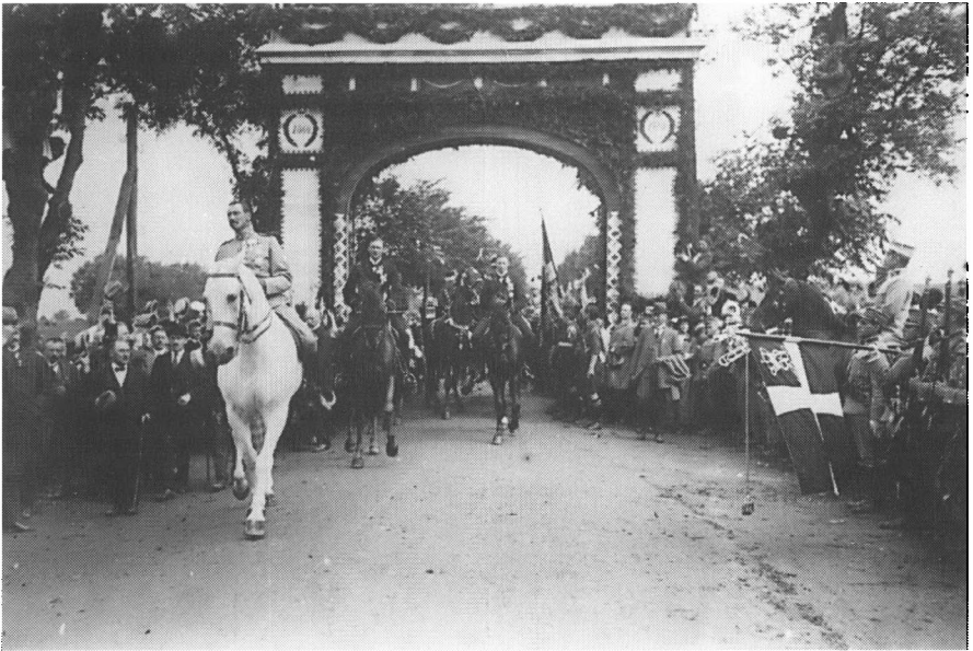
Kongen rider over grænsen ved Frederikshøj 10. juli 1920.

rien om den kongelige byrd øvede en vis tiltrækningskraft på folk, og man omgik Fanny med respekt.