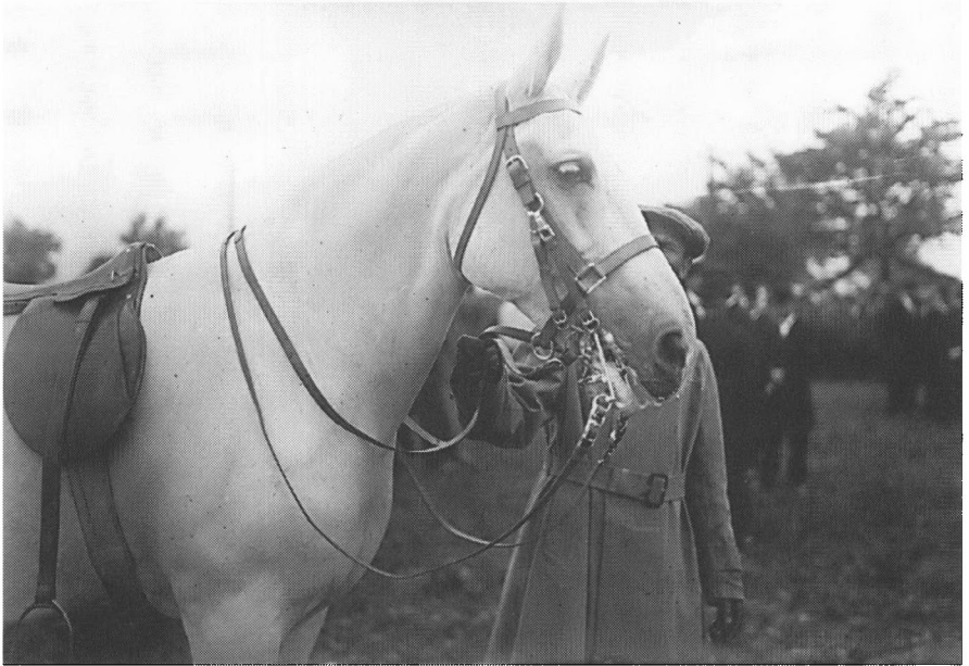
Malgré Tout på festdagen 10. juli 1920.

Politiken kunne den 14. juli 1920 fortælle de interesserede læsere, at den hvide hest var en ung vallak og et usædvanligt smukt og fredeligt dyr. »Saa let som en Hjort, smidig, trind og blød i Koderne som Musklerne i en Danserindes Ankler. Dens Vandring over Grænsen foregik under Massernes lyttende, ventende Tavshed som i Eventyrets drømme.«