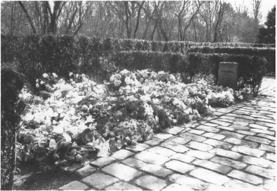
Blomsterpladsen på Bispebjerg kirkegård i København. Hver ugedag har sit område, hvor blomsterne fra denne dags bisættelser lægges, når afdødes urne skal sættes i den store fælles græsplæne.

til dem og ved begravelsen. De symboliserede trods alt noget smukt og kærligt foruden at gøre begravelsen æstetisk.