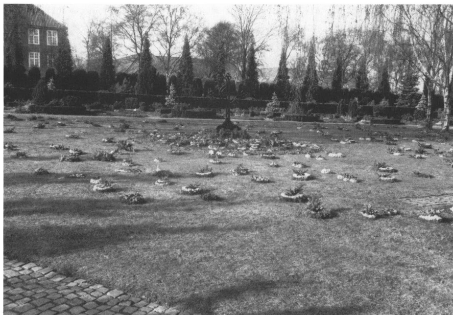
»De ukendtes grav«. Urnebegravelse i en stor græsplæne, hvor de efterladte tilfældigt lægger deres blomster.

efter om forløbet omkring dødsfald og begravelse. Informantens holdninger og adfærd samt verdensbillede kommer mer eller mindre bevidst frem gennem beretningen.