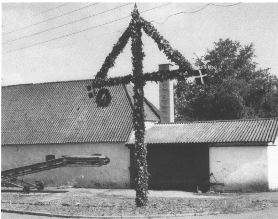
Korsformet majbøg, Glerup 1990. Snorene, der forbinder korsets top og arme, er pyntet med løv. 1990.