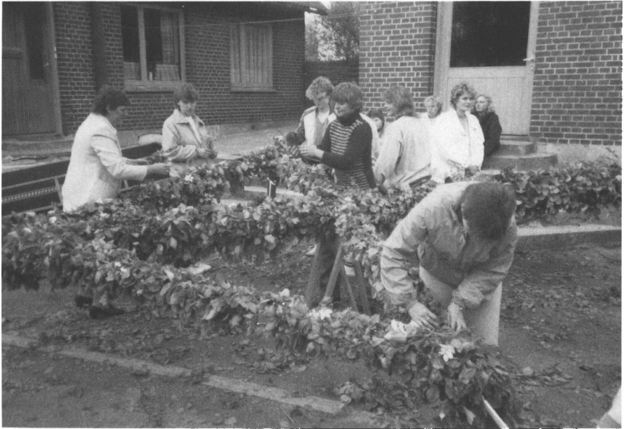
Den sidste pyntning af majbøgen i Glerup, 1986. Her er det kun pigerne, der pynter med blomster. Bemærk konen yderst til venstre, som ikke kunne lade være med at hjælpe til, var ellers kun tilskuer sammen med sin mand, men havde tidligere deltaget i majbøgsfesten.

rup oplevede jeg, at det var pigernes opgave at lægge sidste hånd på den ved at pynte den med blomster. Her trak alle mænd sig tilbage og pigerne alene udførte det sidste, og det var også tilfældet i Korup i 1990 (18). – Det var i øvrigt morsomt at se i Glerup, at der var en af tilskuerne, åbenbart en kone, som tidligere havde været med, der ikke kunne lade være med at hjælpe de unge piger. Der var dog cirka halvdelen af pigerne, der blev demonstrativt siddende, da mændene sagde, at nu var det deres tur (6).