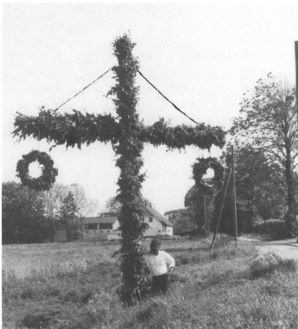
Korsformet majbøg i Siem 1982. Her er en snor fra korsets top til dets arme, som ikke er pyntet med løv. I snorenes ender hænger kransene frit. 1982.

viklet sig til folkefester med langt over 100 deltagere, hvortil der kommer deltagere fra omliggende byer.