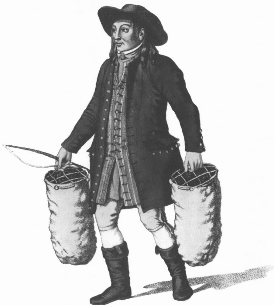
Kulsvieren var en kendt figur i de københavnske gader, her afbilledet i Senn og Lahdes »Klædedragter i Kjøbenhavn« (1806-).

bønderne større summer væk til kronen, bl. a. for besætningen på gården, så det er i de færreste tilfælde, at der bliver noget til overs til arvingerne.