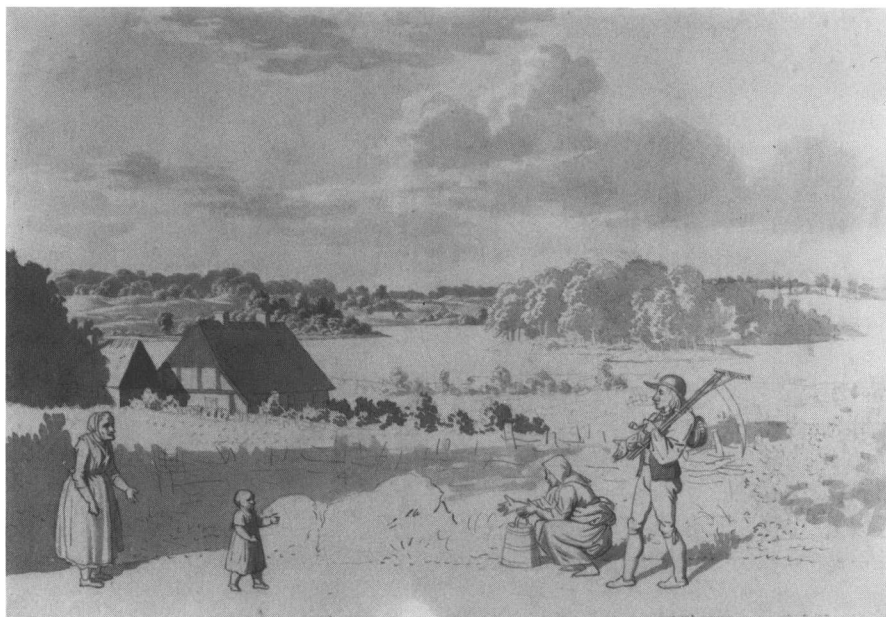
Nordsjællandsk landskab uden for en landsby i skovegnene. Kålhaven er indhegnet med et risgårde, vangenens smalle åse strækker sig ned mod en sø. Den dyrkede jord på den anden side af søen ligger spredt imellem stråskov, enkelte træer og kratgrupper. I baggrunden lukker skoven helt for udsynet. C. V. Eckersberg, Kobberstiksamlingen.

deriksborg amter ofte havde store restancer i skat og landgilde, så afslag tit var nødvendige. Kommissionen gik grundigt til værks og rejste rundt i begge amter for at undersøge forholdene. Der blev stillet en række spørgsmål til bønderne i hver landsby, også om deres foresattes, amtsskriveren og amtsforvalteren, behandling af dem. Kommissionens konklusion var, at bønderne næsten udelukkende angav, at årsagen til deres fattigdom var naturforhold: Dårlig jord, flyvesand, misvækst, onde urter og vildt havde ødelagt deres korn. Kommissionen pålagde bønderne at brakke jorden bedre og holde bedre vagt med vildtet.