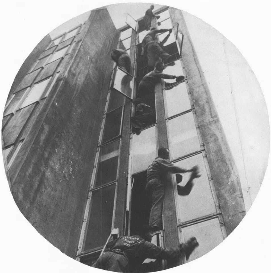
Og her er firmaet Standards folk igang med den høje trappe til Ølandshus.

En meget lille vinduespudser må finde sig i at blive beskyldt for at være ansat af hensyn til kældervinduerne. Tilsvarende kaldes en meget lav stige kælderstigen . Hvis den meget lave pudser spadserer på gaden, får han på et eller andet tidspunkt besked på af sin makker om at lade være med at bruge kantstenen som gelænder. Man spadserer jo ude på gaden, hvis man har en stige på nakken. Går man inde på fortovet, bliver man let glasmorder – man rager let et af udhængsskiltene ned. Den meget høje pudser må ofte høre, når han skal pudse anden sals vinduer udefra, at han ikke behøver tage stige med.