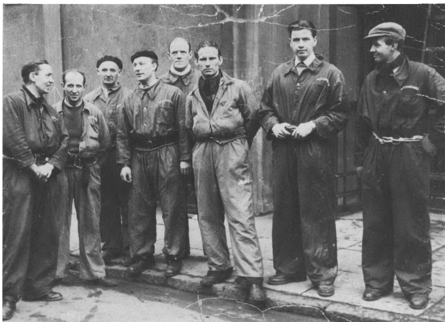
Samtlige pudserne i vinduespudserfirmaet Standard stillet op til ære for fotografen en dag i slutningen af 40'erne foran Ølandshus, Amagerbrogade 62.

hele repertoiret, hele den tyrkiske musik, alle ti kontakter – kort sagt hele armen.