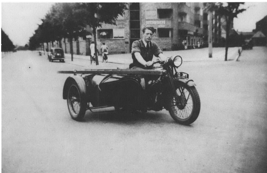
Vinduespudser på Husqvarna motorcykel. Fotografiet er fra 1934.

Det var han nu også. Alene det, at han selv stiller op i kælderens og fortæller det, siger jo et og andet om ham. Men en brav gut og en førsteklases kammerat. Udmærket begavet, selv om man skulle tæt på ham for at blive klar over det – og have en stor tålmodighed. Han snakkede nemlig som et maskingevær skratter. Navnet Fantomet havde han fået, fordi han om vinteren stoppede kedeldragtens bukseben ned i nogle vældige støvler og havde en hjelm på hovedet, der gav ham en sporadisk lighed med tegneseriefiguren. Fantomet begik selvmord med gas midt i 50'erne, kun et par og tredive år gammel. Motivet meget gådefuldt for alle, der ikke kendte ham meget, meget godt. Han var jo udadtil den evigt smilende og glade, der tilsyneladende nød at være ethvert selskabs klovn.