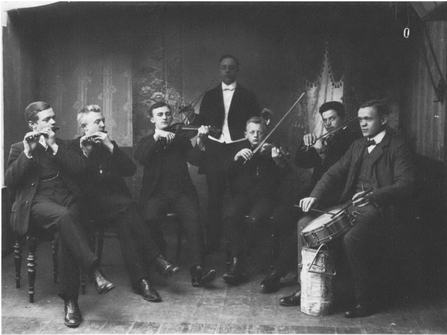
Efterhånden som salene og de dansendes antal blev større, kunne en enkelt spillemand ikke længere høres. Spillemændene fandt derfor ofte sammen i regulære orkestre med blandet instrumentering, som her i orkestret Harmonia fra Aagaard 1911. (Foto på Nationalmuseet).

dog ikke er ført ind i denne bog. Den gennemsnitlige indtjening pr. spillegang er nogenlunde stabil, men antallet pr. år svinger meget. Andersen spiller fra 10 det første år til 54 gange i 1894, Riis når op på 83 gange i 1885.