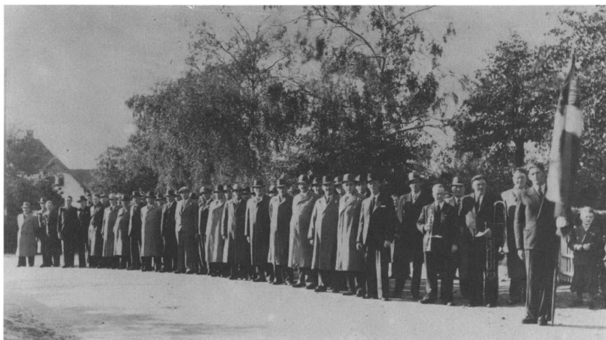
Skytterne ved 75 års jubilæet 1941 parate til marchen gennem byen.