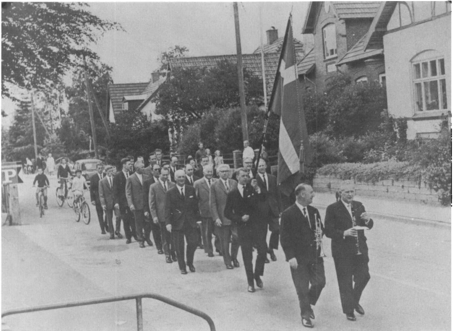
Den sidste skyttemarch i Højby 1966. I takt, i kolonne og under kommando!

Skytterne arbejdede i forhold til og inspireret af en – i den øvrige bestyrelses øjne – forældet ideologi, mens den øvrige bestyrelse arbejdede i forhold til de praktisk foreliggende opgaver. Arbejdsgrundlaget var så forskelligt, at man ikke kunne nå hinanden.