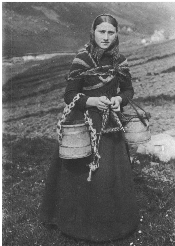
Kvindelige sysler: Malkepigerne strik- kede tidligere på vejen mellem gården og køernes græsgange. Foto: F. Børgesen, o. 1900.