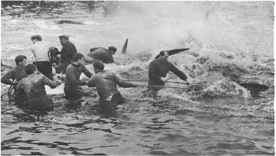
Grindedrab. Toppunktet af mandlig fællesaktivitet.

havet brugtes sjómál i stedet for dagligdags færøsk. I sornhuset anvendte man sornhúsmál . Sjómál og sornhúsmál er særlige kodesprog, hvor bestemte genstande, dyr, fugle, fisk etc. betegnes ved noanavne, dvs. omskrivninger. F.eks. kaldes i sornhuset ild ( eld ) for aske eller små-gløder ( eimingur ) (4). Sjómál bruges af mænd på fiskeri og omfatter fiskeriet, køer, præster, fugle m.m. Fiskefangstens størrelse må ikke nævnes, og der bruges omskrivninger for agn og knive. Køer kaldes for de langhalede og præsten for den sidklædte. Får, der hverken, som køerne, forbindes med den kvindelige sfære eller, som præsten, med den sakrale, kaldes på havet som på land for seyður .