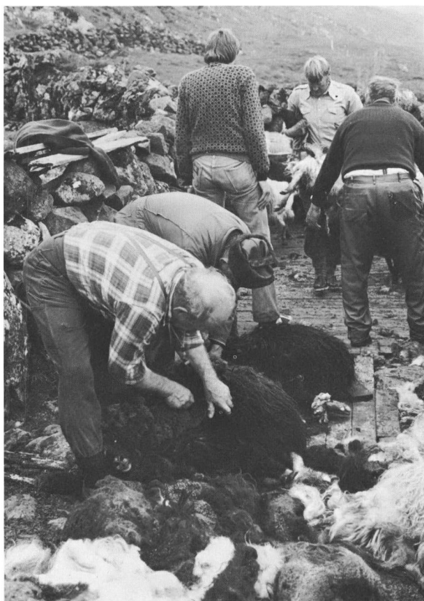
Mandsarbejde, fåreklipping på Sandoy.

det kommende års fælles landbrugsanliggender, hyrder vælges m.m. Selv om både mand og hustru ejer jord, drives den under ét, og manden stemmer på husholdets vegne. På samme måde medregnes mandens moders jord, hvis hun sidder enke; det er altså kun mændene, der deltager i disse møder, hvor de repræsenterer både kvindernes og deres egne rettigheder.