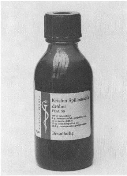
»Kristen Spillemands dråber«.