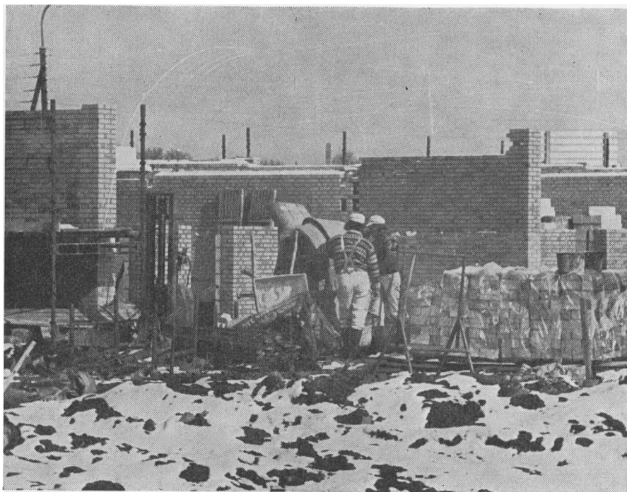
Byggeplads i Roskilde. Vinterbyggeri. (Foto: Bent Olsen 1976).

– Er det også sådan, for nu at vende tilbage til skursammenhængen, at arbejdsmanden sidder i det samme skur som jer?