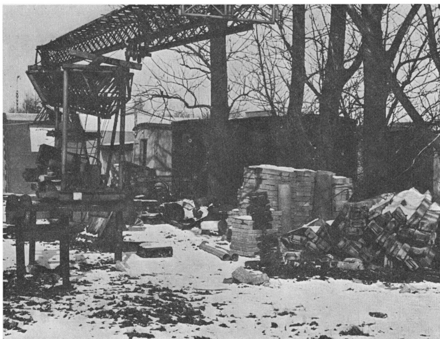
Adgangsforholdene til en skurby. Der er ikke noget at sige til, at det kniber med at holde rent i skurene.

lister op. Der gik jeg nede i fjorten dage. Så kom han ned om formiddagen med en tår at drikke, og så kom de ned og kaldte, når det var middag, så gik jeg op og spiste. Der var en læredreng med, han kom ned om eftermiddagen ved tre-tiden. Det var drikketid, og så havde de en lille én med, og jeg drak sodavand og han drak bajer. Og han lurede lidt på mig. Det havde han s'gu aldrig set. En elektriker, der drak sodavand hele dagen.