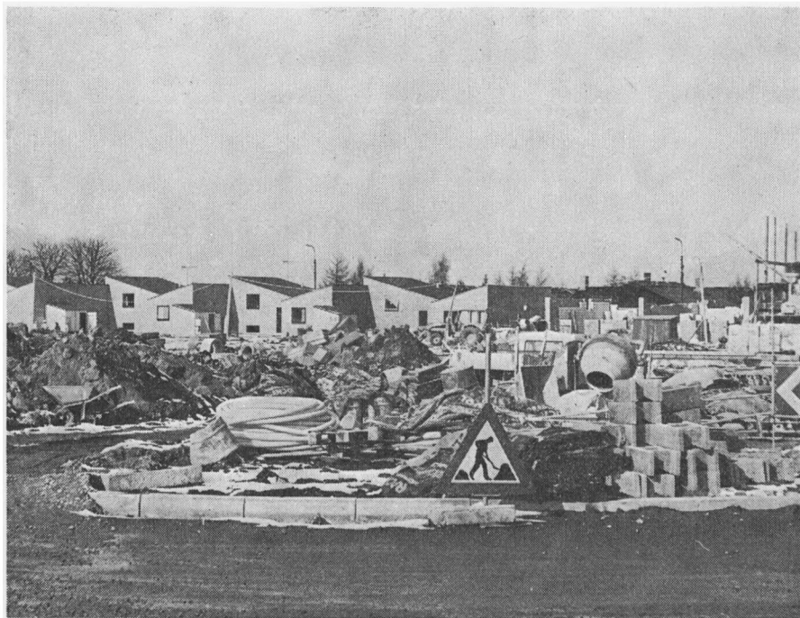
Typisk vinterbyggeplads, hvor mesteren sparer udgifterne til oprydningen. Her havde der været vrøvl med Arbejdstilsynet et par gange.

Det ved jeg ikke. Jeg mener, de fleste kører nogenlunde med de [regler] der. Altså nu fx. elektrikere tror jeg ikke gør det så meget. Men nu murerne, de får altid skyld for at hænge sig i forskellige reglementer – for sikkerhed og alt sådan noget. Det er ligesom mange andre håndværkere sløser med sådan noget. De kan ikke rigtig trumfe nogen igennem uden faktisk . . . de skal lige snakke med murerne først, fordi murerne har altid stået meget stærkere på en byggeplads. Der er mere sammenhold murerne iblandt end indenfor andre faggrupper. Lad