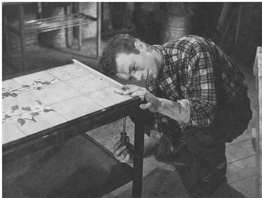
Hjemmenes afdeling, reparation af møbler.

der var to om året, nemlig når skolen lukkede for sommerferien, og når den åbnede efter denne. Skolen var jo som nævnt lukket i juni, juli og august.