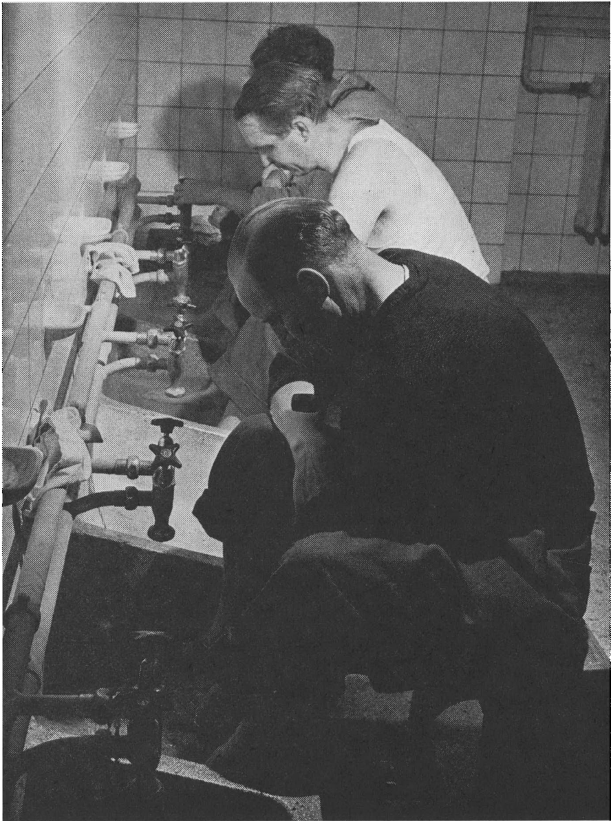
Det gav 1 point at vaske fødder.

Så var der problemet, om man var dansker eller bonde : en dansker var en, der var født i København – det uanset hvad der stod på dåbsattesten; talte man