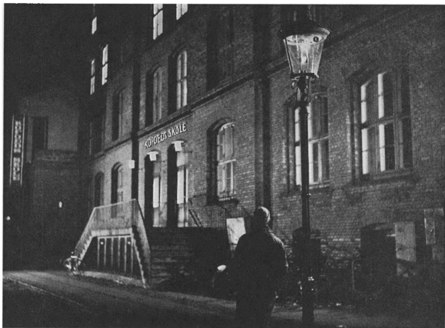
Skolen i Dronningensgade.

Nu er tiden inde til »plat« af forskellig slags, mens man parvis trækker gennem byen på vej til »systemet« på Christianshavn (: Koføeds Skole), hvortil man ankommer i løbet af eftermiddagen. Her tilbringes resten af dagen og aftenen. Men ved 22-tiden går jagten efter natlogi ind. Man finder sig en trappeopgang, hvor der er loft (varme trækker som bekendt opad) – her er der varmt, selv om det fryser udenfor. Nogen kender til et elevatortrum, hvor man ved der ikke er låst, og andre kender til svenskevognene . Det er kun nybegyndere, der sover i S-tog. Der er selvfølgelig også dem, der kan tage på herberge. Men for dem allesammen gælder den store overfrakke som varemærke, de er bumser og så romantisk frie – (ja, Gud hvor romantisk). En del er på pudimut for at holde varmen, en del for at glemme, men flere fordi det smager forbandet godt med en dram, før man lægger sig, med mappe eller taske som hovedpude, benene trukket op i frakken, og sover ind.