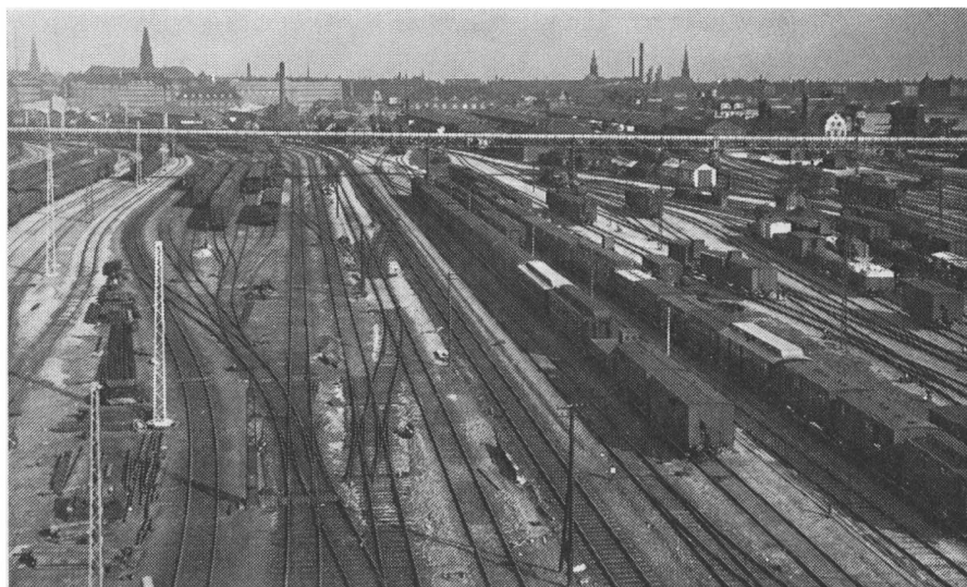
»Svenskevoغنene« ved Dybbølsbro.

erklæret for at være subsistensløs, eller som det hed, mere populært, løsgænger . Ved snefald mødte man så – ved det nærmeste vejdistriktkontor – kl. 7 morgen eller kl. 19 aften; det var populært arbejde, da det gav gode penge, og man blev ikke overanstrengt, da man det meste af dagen sad og gemte sig på en eller anden kaffebar; når man tog den skulderrem – som man fik som et tegn på, at man arbejdede på vejen – af og gemte skovlen, var der jo ingen, som kunne se, at man var i arbejde, og kom formanden, ja, så var man jo lige inde og få sig en »bid brød«; det var kontant betalt, og en god vinter var, naturligvis, en med mange små snebyger.