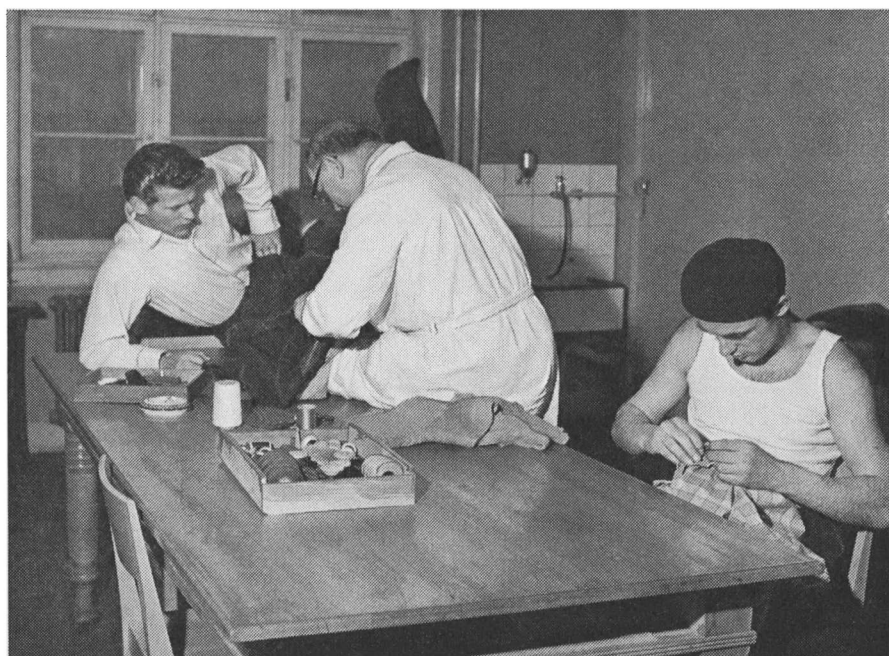
Ligeså at reparere tøj – skrædderafd.

rundture i hallen, hvor de så talte med dem, som de kunne se havde brug for det; de blev ofte standset af folk, som søgte hjælp af forskellig slags, dog var det mest overnatning, der var brug for. Kvinderne kunne man sende til »huset for faldne kvinder« på Jagtvejen (det hed det virkelig! – i hvert fald stod det på ordensreglementet for stedet). Det blev kørt af nogle diakonisser. Mændene derimod kunne man sende til forskellige herberger, af hvilke der var Kirkens Korshærs i Hillerødgade, Frelsens Hærs herberge for mænd på Amagerfælledvej og Frelsens Hærs ungdomsherberge på Frederikssundsvej (var kun for unge mænd under 25 år, og det var indrettet på den gamle Politistation no. 8, hvor Enevig i så mange år havde tjeneste, og hvor han samlede en stor del af sit materiale), mændenes hjem i Lille Istedgade, samt naturligvis Sundholm på Sundholmsvej (på Sundholm var der også en kvindeafdeling). Men der var en hage ved det at bo på herberge, og det var, at herbergerne havde pligt til at melde alle personlige data til politiet, og var man eftersøgt for den mindste lille ting, ja! så stod der to flot uniformerede herrer ved ens »køje« kl. 4,30, og man fik en køretur til den nærmeste politistation for at få »bragt sine forhold« i orden. Dette afholdt naturligvis mange fra at bo på herberge, og derfor måtte de gå »brandvagt«.