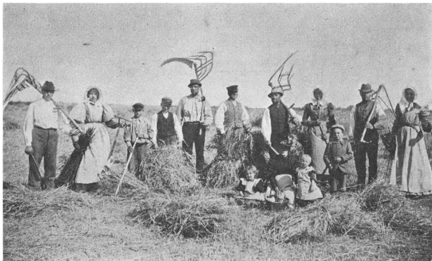
I ældre tid havde børnene deres naturlige plads i arbejdslivet. Der var næsten altid momenter i arbejdet, som de kunne udføre. Høstarbejde på en gård i Thorup, Nordfyn, 1899.

søgte at undgå, var af dette materiale at dømme især tyvagtighed, løsagtighed, dovenskab og gerrighed. På tilsvarende måde kunne man ifølge folketroen fremme disse egenskabers positive modstykker: ærlighed, flid og gavmildhed. En husmandsdatter, født 1872, som voksede op på Vestlolland skriver således: