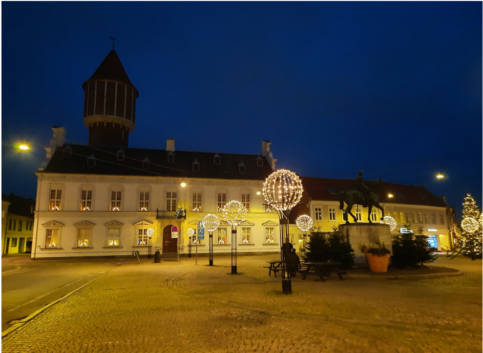
Det gamle Nakskov Rådhus, som Lolland Kommune i 2018 solgte til staten for at gøre plads til Nota.

rende reformer, men snarere mod lige nøjagtig nabokommunen, Maribo. 93 Og for det andet viser Peters beretning, hvordan Notas indflytning i akkurat det gamle Nakskov Rådhus uvægerligt kommer til at revitalisere det identitetsmæssige tab af kommunal selvstændighed gennem næsten 140 år, som sammenlægningen i 2007 førte til for Nakskov: