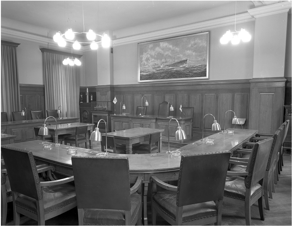
Byrådssalen i Nakskov Rådhus, 1966.

lerede er lagt tanker og hensigter i, og som har en historie og bærer spor efter tidligere beboere”. 48 Renoveringsprocessen skulle omforme den tidligere rådhusbygningens indre til Notas eget. Mens istandsættelsen pågik og i takt med, at en række ansatte meldte deres opsigelse fra og med udflytningsdatoen, var Nota i mellemtiden begyndt at rekruttere nye medarbejdere. Størstedelen af disse kom fra det sydsjællandske og lolland-falsterske arbejdsmarkedsområde, inklusive en række nakskovitter. De ansatte, som beholdt deres job (hvilket talte omkring halvdelen), er enten flyttet til lokalområdet eller har arrangeret sig i pendler-bofællesskaber, hvor kolleger på ikke-hjemmearbejdsdage bor sammen i hverdagene.