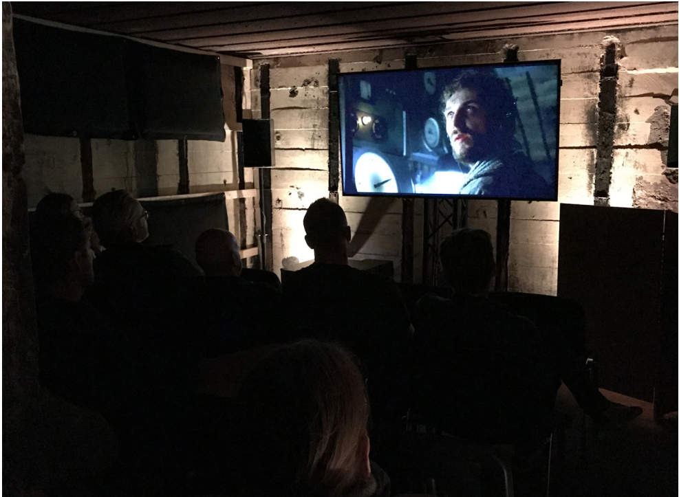
Klaustrofobiske scener: Fremvisning af Das Boot (Ubåden), Wolfgang Petersens prisbelønnede film fra 1981, afspillet i en bunker i udkanten af Ringkøbing under Bunker Film Festival 2018 .

kontinuerlige – og indtil nu ret succesrige – forsøg på at frakende bunkerne i Houvig enhver status som andet end netop spild. ”Ambiguous things can seem very threatening”, skriver Douglas i forordet til 2002-udgaven af Purity and Danger . 67 Hun forklarer, på linje med Baumans senere pointer, at hendes bog rummer refleksioner over ”the cognitive discomfort caused by ambiguity” og tilføjer, at denne type ubehag typisk søges bragt under kontrol gennem lokale teorier om det forurenede/malplacerede objekts angivelige skadevirkninger. 68 I mine eksempler fra Vestjylland er det ikke vanskeligt at pege på noget, der minder om sådanne stedlige ”teorier”, for eksempel i den omtalte betoning af de fysiske farer, betonresterne udgør for de badende. Pointen hos Douglas er altså, at en sådan modstand, både i den lille skala som her, men også udtrykt i bredere samfundsmæssige forbud og tabuiseringer, i bund og grund opstår som svar på den modvilje, de ”uordentlige”, ikke-placérbare fænomener vækker. I det perspektiv kan de lokale forkæmpere for en ”uspuleret” natur i Houvig forstås som beskyttere og medskabere af langt mere dybtgående idéer om renhed og klare linjer, hvor tingene, menneskene, sæderne og skikkene for alt i verden skal blive på deres ”rette