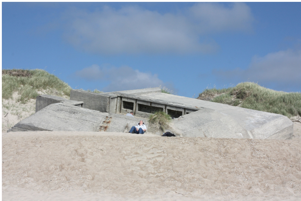
Kultur eller natur? En kuldsejlet bunker på stranden nær Houvig benyttes til ophold og solbadning på en sommerdag.