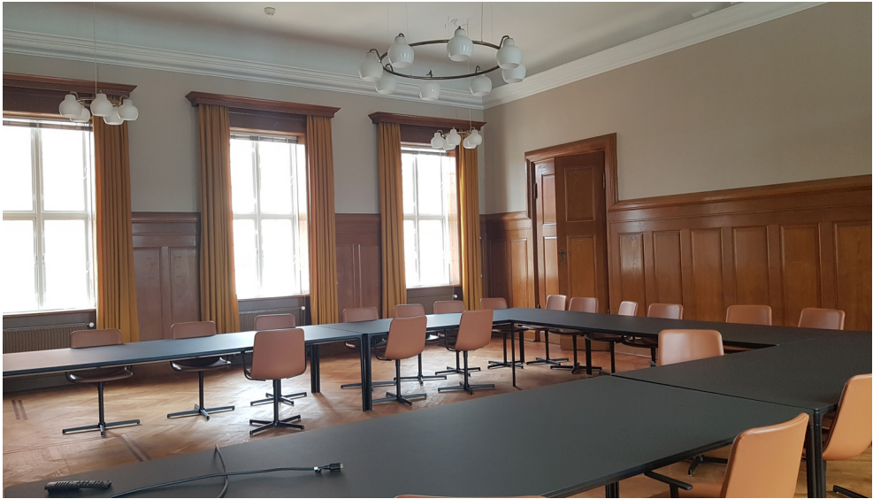
Rådhusbygningens forhenværende byrådsal efter Notas indflytning og ommøblering.

længere tilbage end dets aktuelle beboeres. 62 Hun skriver: "[s]pøgelser og ting har i den forstand samme funktion, i og med at de minder om kontinuitet, om fortidens tilstedeværelse i nutiden, om det, der ikke kan slippes". 63 Og som Daniel Miller har påpeget: jo ældre et hus eller en bygning er, jo større er chancen for husspøgelser. 64