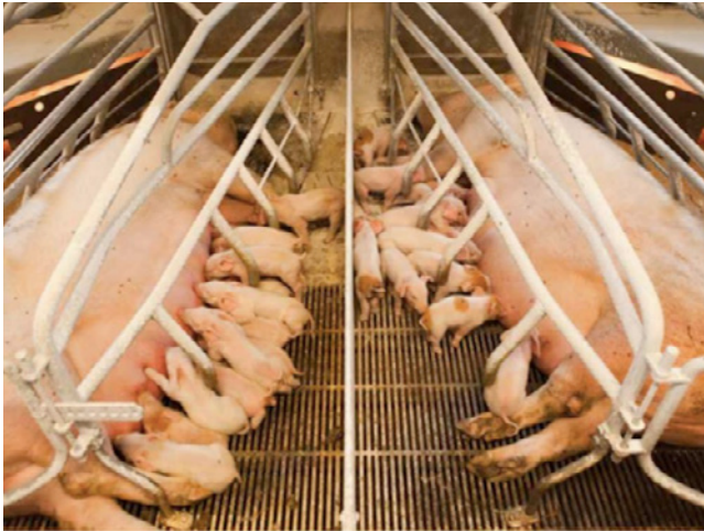
Illustration nr. 2 Dyrenes Beskyttelses medlemsblad Dyrevennen april 2017. Billedet ledsager en artikel Ligger landet virkelig sådan? - skrevet i samarbejde med Danmarks Naturfredningsforening.

her forskelle i repræsentationerne af henholdsvis 'konventionelt' og økologisk landbrug – hvordan de to praksisser opfatter sig selv og hinanden, og hvordan forbrugerne og befolkningen ser på de to produktionsformer. Økologien udgør endnu så lille en del af arealanvendelsen (8%), at en analyse af dens kulturelle placering ville kræve en nærmere kortlægning og diskussion af forhold internt i erhvervet, såvel som samfundsforhold, der ligger udenfor denne artikels felt. Helt kort kan det dog konstateres, at økologerne har et meget positivt omdømme i offentligheden, hvilket har fået den konventionelle del af erhvervet til i nogen grad at kopiere de billeder og historier, som økologerne markedsfører sig selv med.