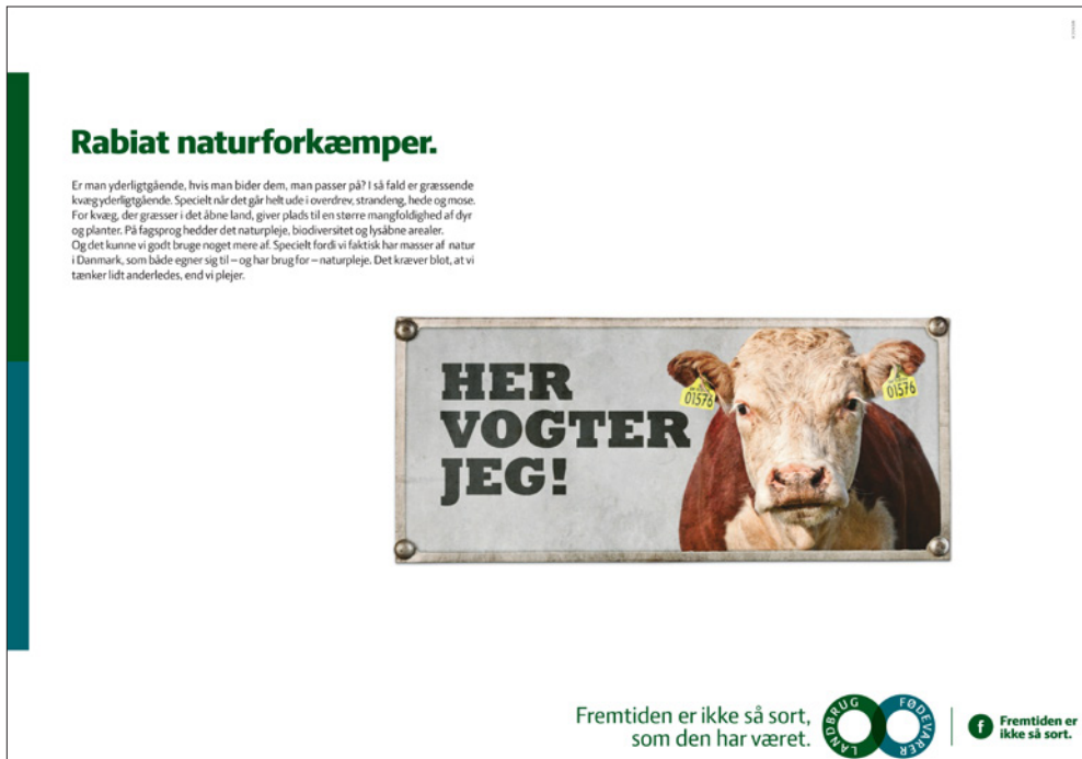
Illustration nr. 1: Landbrug & Fødevarers Omdømmekampagne.

der måske kan kaste lys over landbrugets egen indstilling til dets omdømme og repræsentationer.